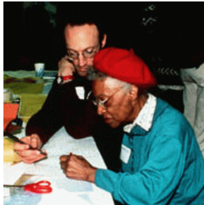
Sensitividad en el Diseño: Harlem Gateway Corridor, New York. En este proyecto se usaron fondos del Programa de Realce en la Transportación (Transportation Enhancement Program), donde la Comunidad de Harlem participó en el proceso de diseño para mejorar el aspecto visual del corredor a través de iluminación, siembra de árboles, diseño peatonal atractivo y murales que celebran la herencia cultural de la comunidad.