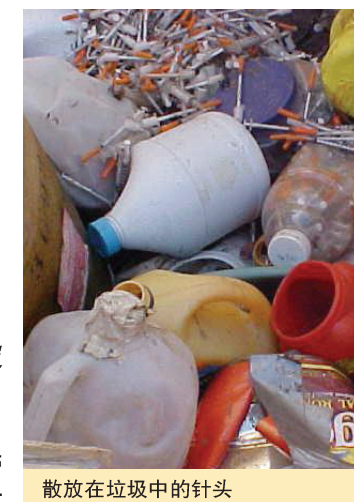
散放在垃圾中的针头

法律规定必须把所有的注射器针头当作携带病菌的物品来处置。这意味着如果有人被注射器针头刺中，则必须接受费用昂贵医疗测试，检查是否有可能被传染上疾病，甚至是致命的疾病。请确保将你使用过的注射器针头以安全的方式处置，以免他人遭受危险。