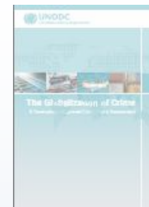
The Globalization of Crime

http://www.unodc.org/documents/eastasiapacific/2010/06/tocta/OCTA_Report_2010_low_res.pdf