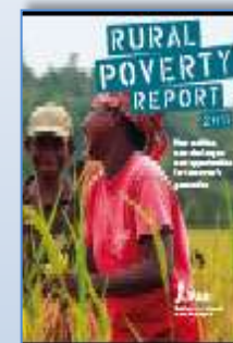
Rural Poverty Report 2011

http://www.unodc.org/documents/eastasiapacific/2010/06/tocta/OCTA_Report_2010_low_res.pdf