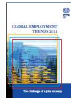
Global Employment Trends 2011

http://www.ilo.org/wcmsp5/groups/public/@dgreports/@dcomm/@publ/documents/publication/wcms_150440.pdf