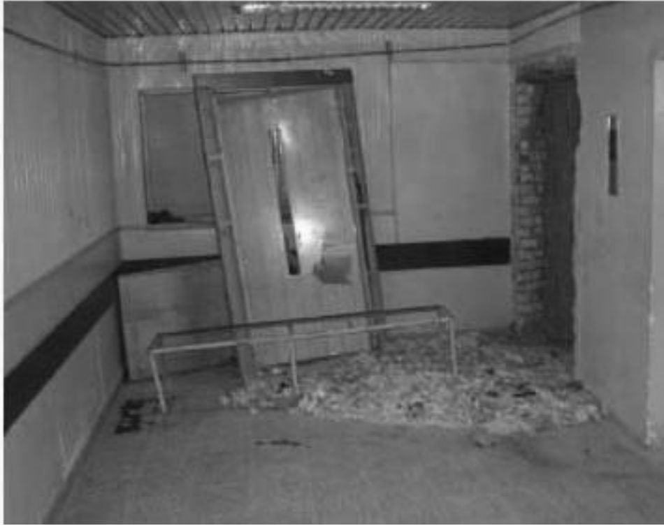
الصورة ١ - مصعد مستشفى الحلة العام

تركيب مصعد جديد. وبما أنه كان قد تمّ تسديد جميع مستحقات المقاول، فلم يتم تحميل المقاول المسؤولية عن متطلبات العقد. قد خسر موظفو منطقة جنوب وسط العراق المال المنفق على تركيب مصاعد جديدة، كما فقد ثلاثة أشخاص أرواحهم.