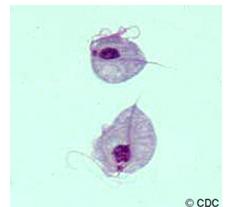
Dos parásitos Trichomonas vaginalis , amplificados (observados a través del microscopio)

Las mujeres embarazadas que tienen tricomoniasis son más propensas a tener sus bebés antes de tiempo (parto prematuro). Además, los bebés nacidos de madres infectadas tienen más probabilidades de tener bajo peso al nacer, según los parámetros oficiales (menos de 5.5 libras).