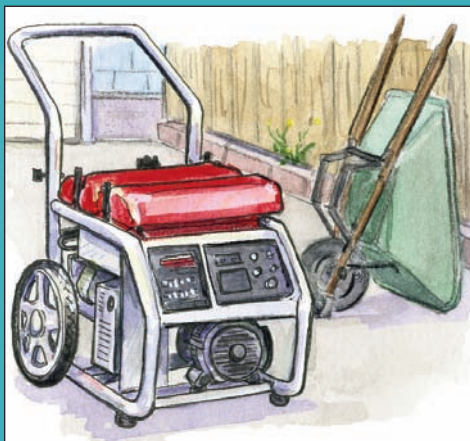
Máy Phát Điện Di Động

Khói hoặc khí độc thải ra từ máy phát điện di động có thể gây tử vong trong vòng vài phút nếu hít phải chúng!