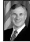
GREG ABBOTT Procurador General de Texas

El dinero en este fondo se recaba mediante los gastos de corte que pagan los delincuentes y es depositado por cada condado en el Fondo de Compensación Para Las Víctimas Del Crimen.