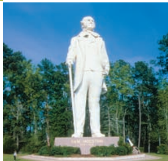
Estadua de Sam Houston, Huntsville

Los aficionados del aire libre se deleitarán con los bosques y las actividades recreativas de Lufkin. Los bosques nacionales Angelina y Davy Crockett rodean a la ciudad con un marco de infinito esplendor natural, y el Texas Forestry Museum, el Ellen Trout Zoo and Park el Museum of East Texas, así como el centro decorado de murales, atraen una atención bien merecida. 📍