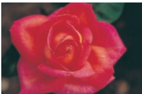
Jardín de rosas, Tyler