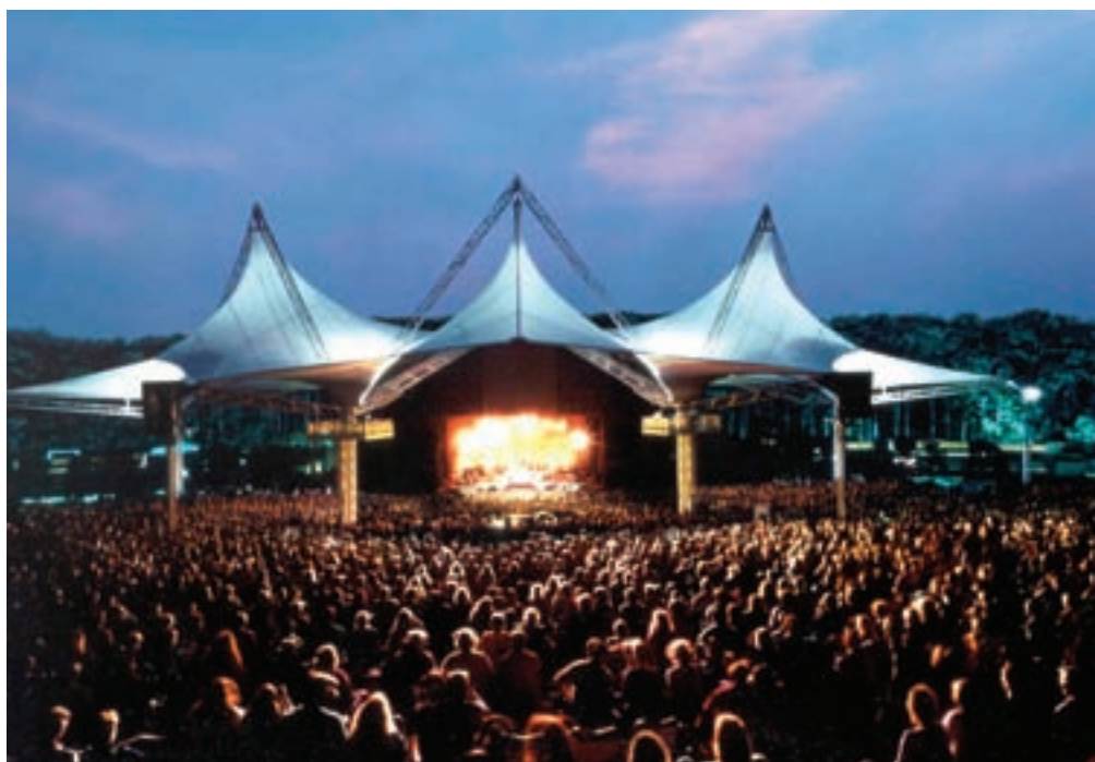
Cynthia Woods Mitchell Pavilion, The Woodlands

Día 2 Viviendas históricas elegantemente restauradas y una agraciada hospitalidad confieren a Jefferson la atmósfera del Sur estadounidense. Después de visitar los lujosos vagones que solían llevar al millonario Jay Gould por todo el país, diríjase al cercano parque Caddo Lake State Park. Este lago natural, contemplativo y misterioso, está rodeado por cipreses pelados con barbas de musgo negro. Participe en una excursión informativa en pontón alrededor del lago para orientarse, o vaya de pesca o a pasear en canoa con un guía local.