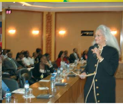
Conférence - Conférence