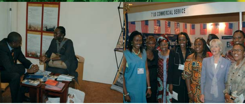
Rencontres - Meetings