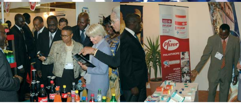
Exposition - Exhibition