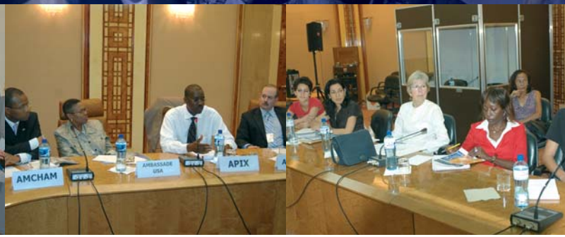
Atelier - Workshop