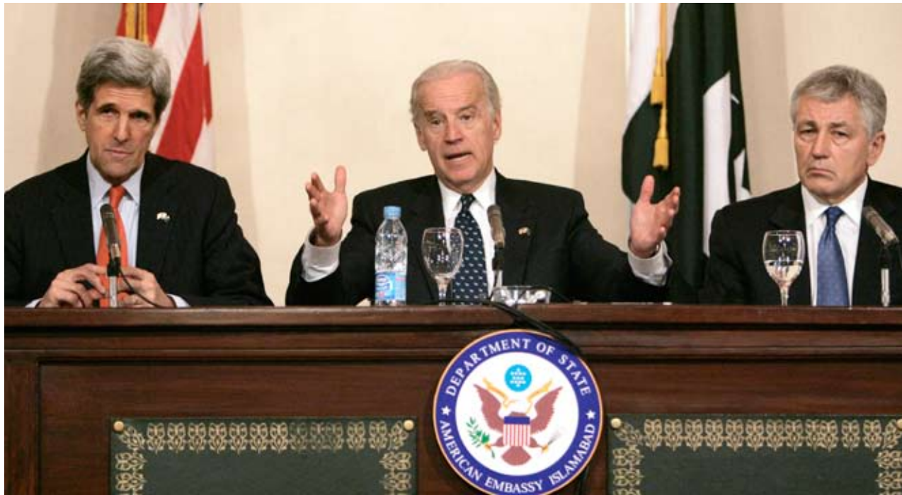
De gauche à droite : les sénateurs John Kerry, Joseph Biden et Charles Hagel à Islamabad, au Pakistan, en février 2008.

dirigeants de l'opposition. Il a traité d'importants dossiers en matière de contrôle des armements, de prolifération nucléaire, d'élargissement de l'OTAN, de rivalité entre les superpuissances, et de relations entre les Etats-Unis et le monde en développement. Il s'est en outre fait l'avocat de l'Initiative mondiale contre le sida et a été parmi les premiers à soutenir les efforts internationaux en vue de limiter les émissions de gaz à effet de serre (il a rédigé la première loi sur les changements climatiques il y a vingt ans). Il a également soutenu la plupart des accords de libre-échange. Il a manifesté un intérêt particulier pour l'Afrique durant toute sa longue carrière de sénateur. Il s'est opposé très tôt au régime de l'apartheid en Afrique du Sud et préconise un renforcement de l'action au Darfour pour mettre fin aux effusions de sang.