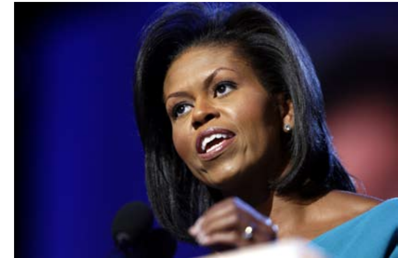
Ci-dessus : Michelle Obama prend la parole devant la convention nationale démocrate le 25 août 2008.

Barack et Michelle Obama espèrent que leur enthousiasme pour le service public, leur expérience approfondie et leurs nombreux succès professionnels les aideront à relever les défis à venir. Toutefois, pour Barack Obama, à l'origine de son désir d'être président et d'exercer une influence positive sur le monde il y a ses deux filles, Malia (née en 1998) et Sasha (née en 2001). Elles sont les plus jeunes occupantes de la Maison-Blanche depuis Amy Carter,