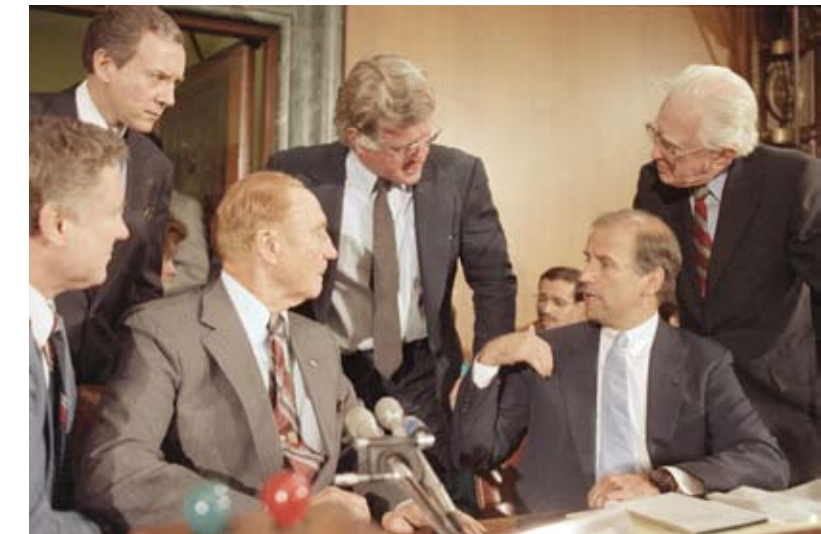
Le sénateur Biden (assis à droite) avec des collègues de la commission judiciaire du Sénat en août 1986.

Avant de voter en faveur de la résolution finale, Joe Biden se rapprochera du sénateur républicain de l'Indiana, Richard Lugar, pour faire adopter une résolution n'autorisant une action militaire qu'après épuisement des recours de la voie diplomatique, tentative qui échouera. Mais il votera aussi contre un amendement qui aurait obligé le gouvernement Bush à demander une nouvelle autorisation avant d'envahir l'Irak. En 2005, il qualifiera son vote « d'erreur ». Lors