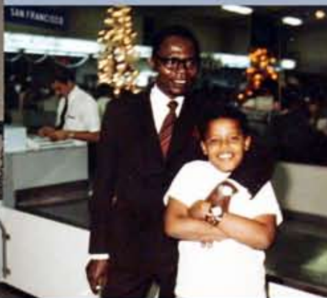
Barack, âgé de dix ans, avec son père kényan Barack Obama.