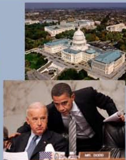
Le sénateur Barack Obama aux côtés du sénateur Joe Biden, président de la commission des affaires étrangères du Sénat.