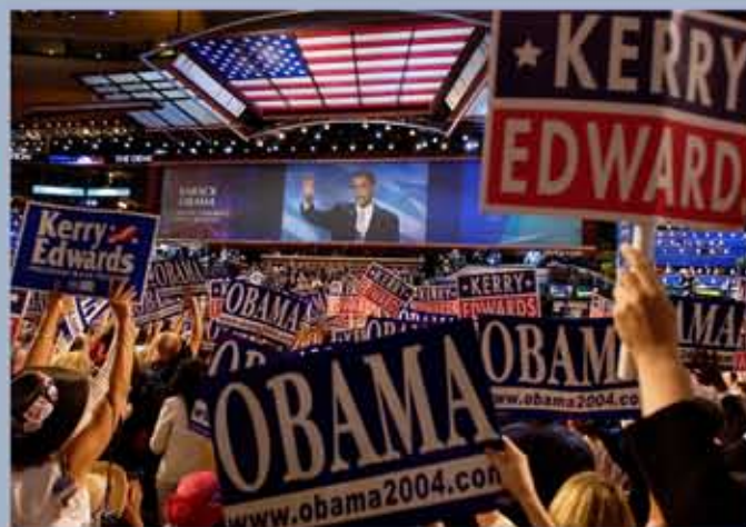
Alors qu'il brigue un siège au Sénat des Etats-Unis, Barack Obama est invité à prononcer le discours phare à la convention du Parti démocrate, le 27 juillet 2004.