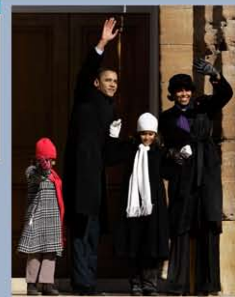
Barack Obama, accompagné de sa famille, annonce sa candidature à la présidence en février 2007.