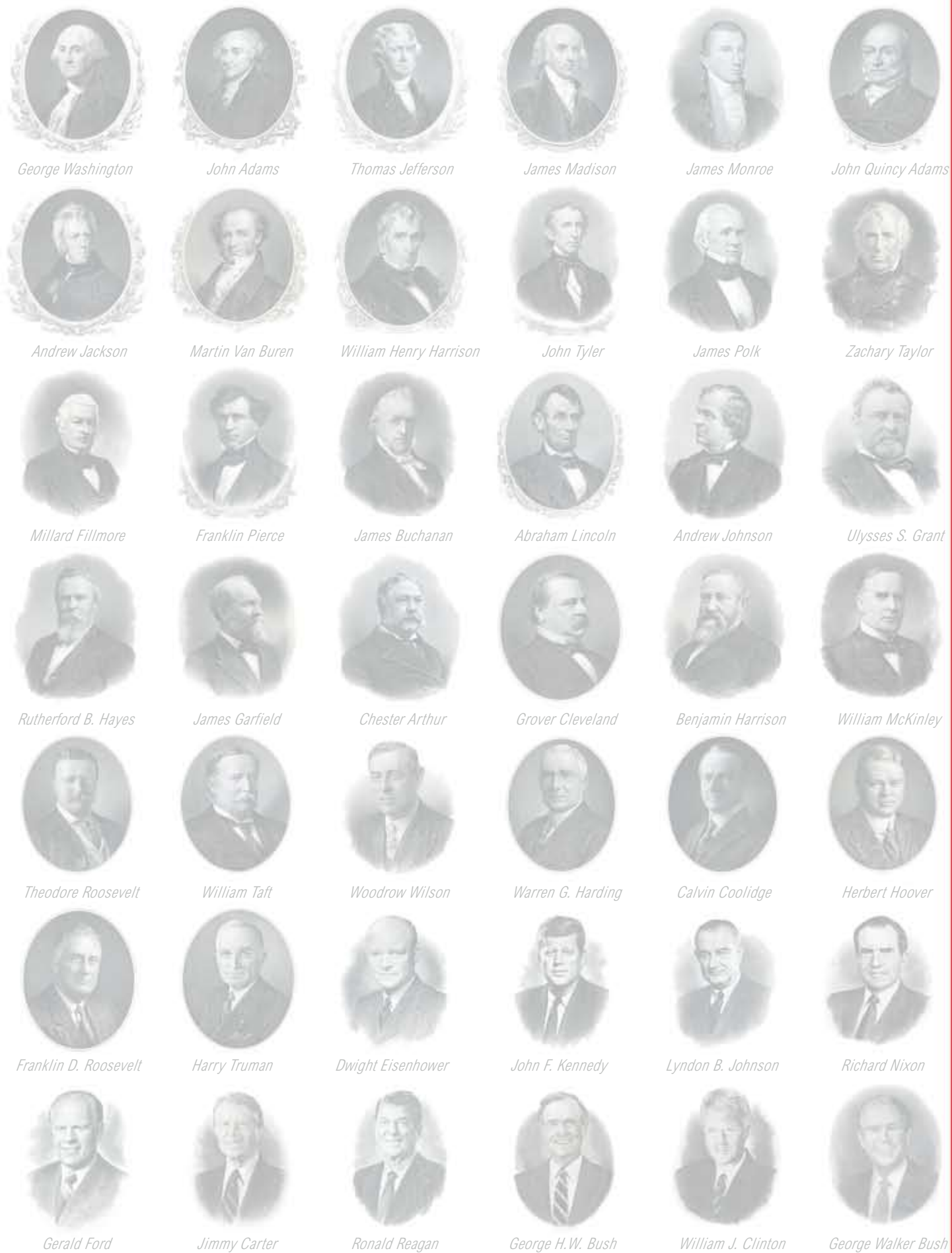
George Washington John Adams Thomas Jefferson James Madison James Monroe John Quincy Adams