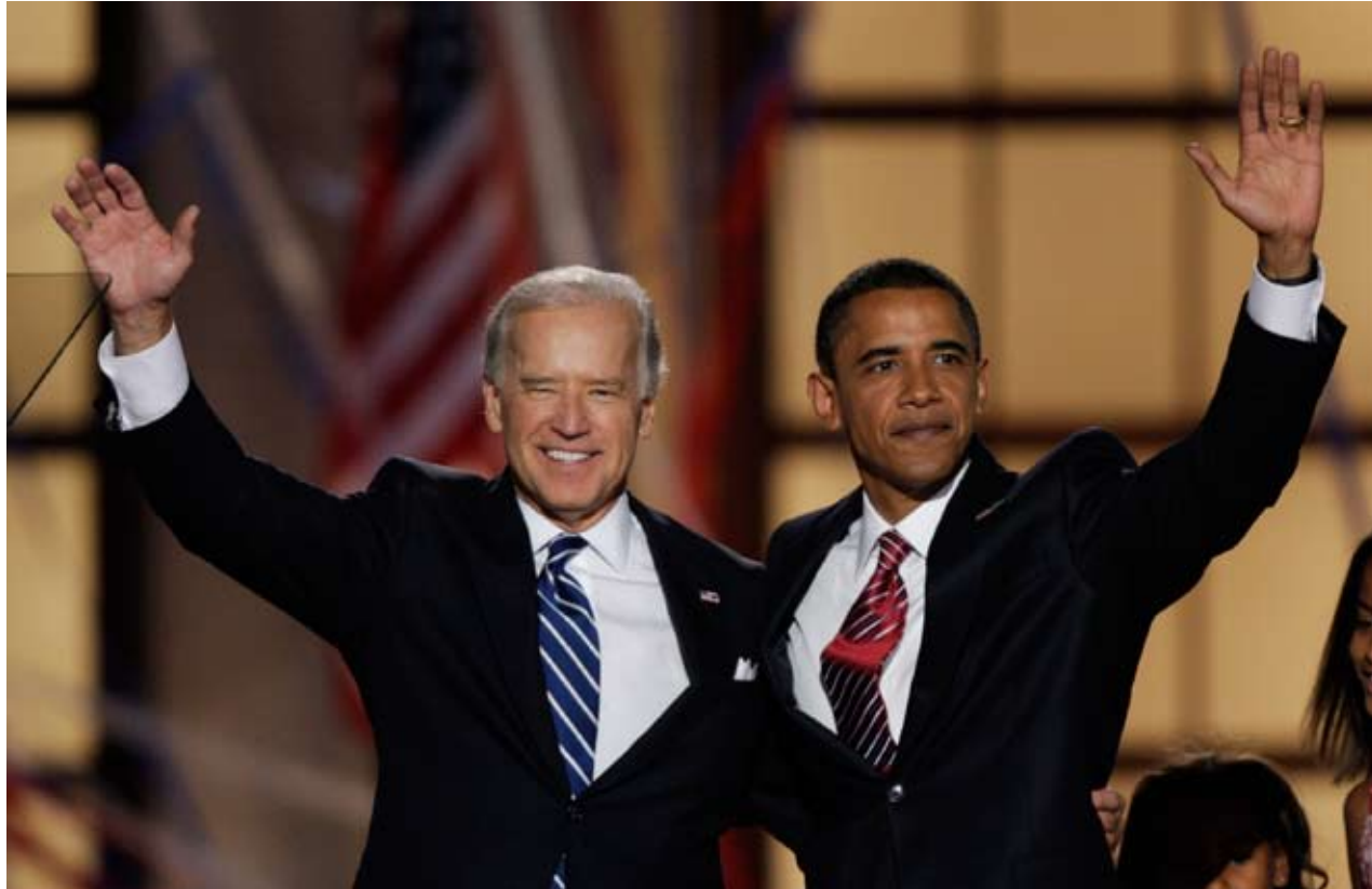
Joe Biden (à gauche) et Barack Obama lors de la convention nationale démocrate, le 28 août 2008.

« Lorsque je réfléchis à ma carrière d'homme politique, je suis particulièrement fier du travail que j'ai accompli pour mettre fin au génocide dans les Balkans et pour faire adopter la loi contre la violence à l'égard des femmes. » Cette citation est extraite de l'autobiographie publiée en 2007 sous le titre Promises to Keep: On Life and Politics par Joseph (Joe) Biden, alors sénateur et aujourd'hui vice-président des États-Unis.