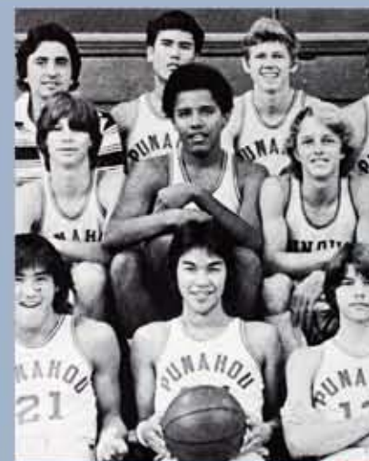
Barack Obama, au centre, au sein de l'équipe junior de basket-ball de son école à Hawaii, en 1977.