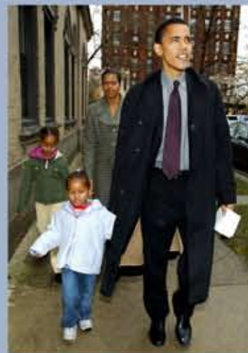
Le candidat au Sénat des Etats-Unis avec sa femme Michelle et ses filles Sasha (au premier plan) et Malia le jour du scrutin en 2004.