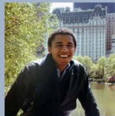
Etudiant à l'université Columbia de New York, vers 1983.