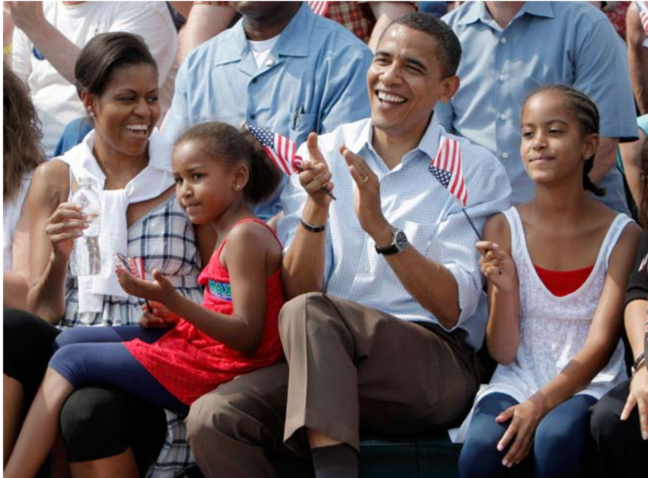
La famille Obama assiste à un défilé le jour de la fête nationale à Butte (Montana), le 4 juillet 2008. De gauche à droite : Michelle, Sasha, Barack et Malia.

P our la première fois, une famille afro-américaine fait son entrée à la Maison-Blanche.