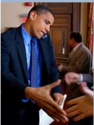
Le sénateur d'Etat Barack Obama en campagne pour siéger au Sénat des Etats-Unis, en juillet 2004.

La longue campagne des primaires des candidats démocrates, ponctuée d'élections ou de « caucus » organisés dans les 50 Etats du pays, a été historique à plusieurs égards. C'était la première fois qu'un Afro-Américain et une femme restaient en lice dans la course à l'investiture du Parti démocrate. Quand Barack Obama et sept autres prétendants à l'investiture du parti commencent à s'organiser en 2007, les sondages placent régulièrement le sénateur de l'Illinois en deuxième position, derrière la favorite pré-