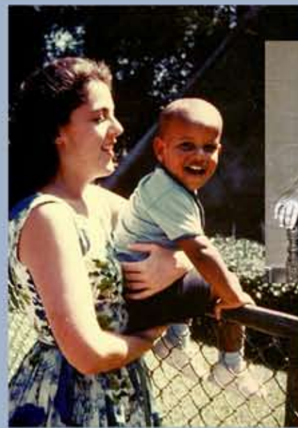
Le jeune Barack avec sa mère, Ann Dunham, vers 1963.

Dans son premier livre, Rêves de mon père , Barack Obama décrit les troubles de son existence d'adolescent, plus nombreux que de coutume, tandis qu'il s'efforce de donner un sens à son héritage biracial, phénomène encore relativement rare aux Etats-Unis. Le fait d'avoir ses racines tant dans l'Amérique noire