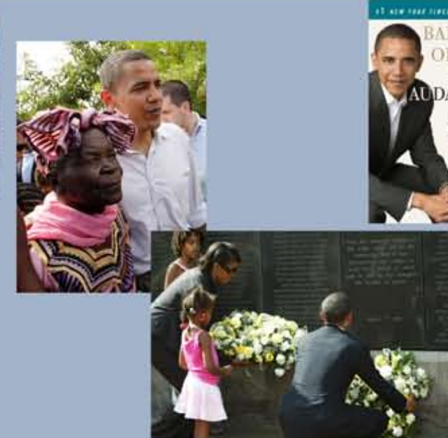
Barack Obama, avec sa grand-mère kényane Sarah Hussein Obama, dans le village de Kogelo, au Kenya, en août 2006.