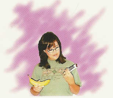
មិនអាចសំរេចចិត្ត ឬ មិនអាចសន្និដ្ឋានគិតបាន