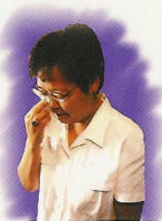
មានអារម្មណ៍ចុះថយ ពេញមួយថ្ងៃ