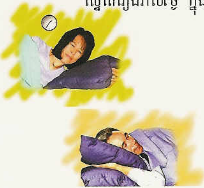
គេងមិនលក់ ឬ គេងច្រើនពេក

ដើម្បីនឹងមានរោគវិនិច្ឆ័យនៃដំណើរការធ្លាក់ទឹកចិត្តសំខាន់ៗនោះ, យ៉ាងហោចណាស់រោគសញ្ញាប្រាំយ៉ាងខាងក្រោមនេះ, មានសរុបទាំង អារម្មណ៍ធ្លាក់ទឹកចិត្ត ឬអន់ថយចំណូលចិត្ត ឬរីករាយជាមួយនិងសកម្មភាពធម្មតា, ត្រូវតែមាន ស្មើតែរៀងរាល់ថ្ងៃ ក្នុងរយៈពេលពីរសប្តាហ៍ ឬលើសពីនេះ ដោយមិនមានបញ្ហាដល់រាងកាយ ។