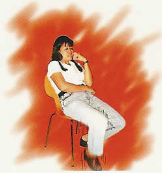
មិនសំរាកកាយ ឬគេមើលមក ឃើញមានភាពយឺតយ៉ាវ