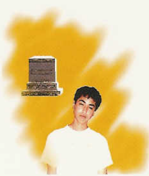
មានគំនិតចង់ស្លាប់ជា ញឹកញាប់ណាស់