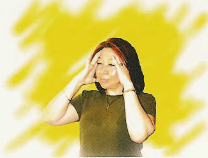
បន្ទោសខ្លួនឯងច្រើនណាស់ និងមានអារម្មណ៍អន់ថយ