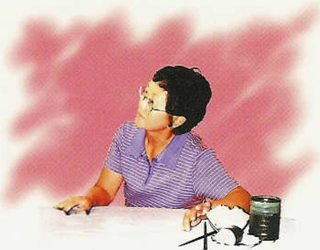
ចំណាំ ថាមានការប្រែប្រួល ខាងទម្ងន់ និងការញ្ញាអាហារ