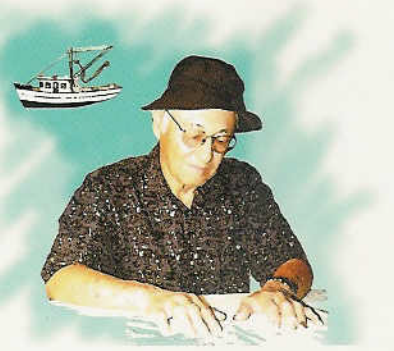
អស់ចំណូលចិត្តនិងសកម្មភាព ដែលធ្លាប់ចូលចិត្ត តទៅទៀត