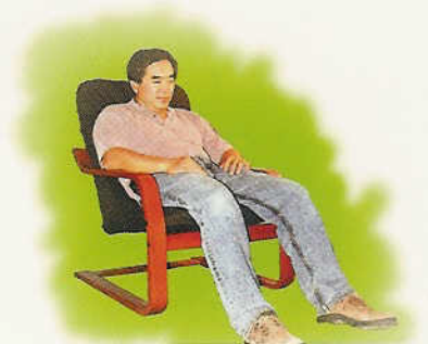
អស់កម្លាំង ឬថាមពល ចុះថយ ស្មើតែរាល់ថ្ងៃ