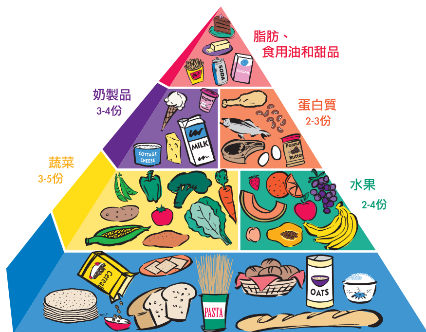
麵包、穀類和麥片 6-11份