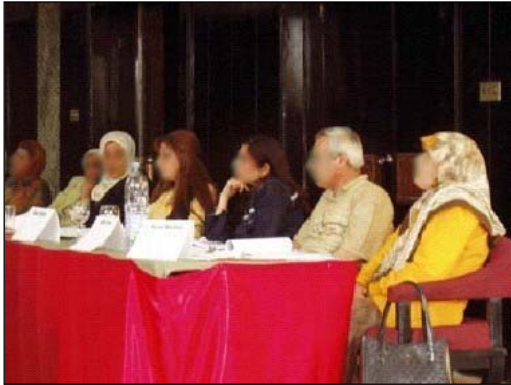
مشاركون عراقيون في احد ندوات تدريب المصارف التي عقدت في بداية هذا العام.