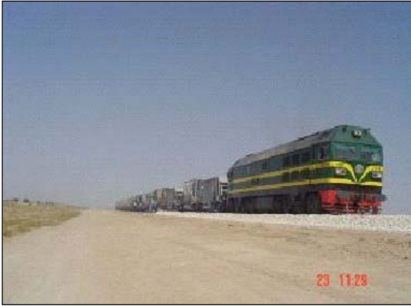
قطار للشركة العامة لسكك الحديد IRR محمل بعربات الحصى المخصصة لمواقع احد المشاريع في جنوب العراق.