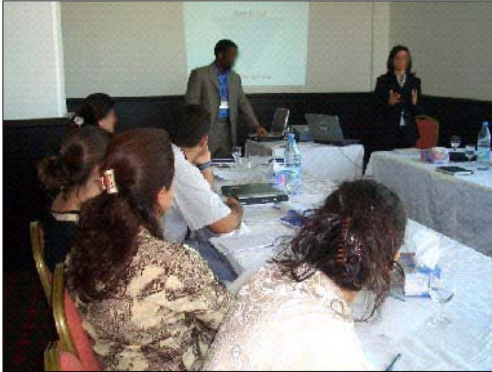
يشارك اعضاء من كادر مراكز الاعمال التجارية القطرية في شمال العراق في محاضرة ادارة تدريبية.