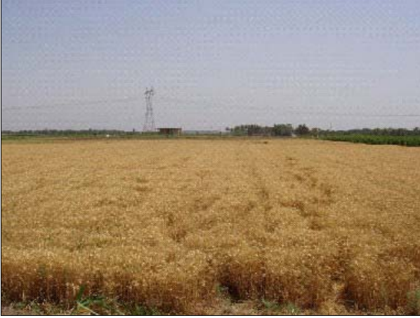
حقل حنطة في شمال العراق ، حيث يعمل برنامج اعادة اعمار الزراعة والتنمية في العراق ARDI مع الموظفين العراقيين والمزارعين لزيادة مساحات زراعة الحنطة والتقليل من استيراد الحبوب .