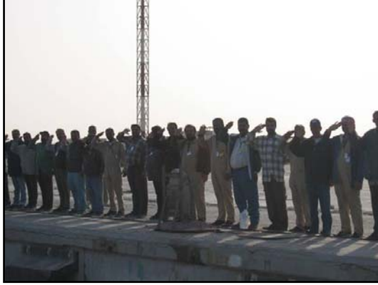
المدربين في هيئة الميناء العراقية.

• تم كري الميناء الى معدل عمق 12.5 متر وقد كان عمق الميناء من 9-10 متر سابقاً ولسفن محددة تستطيع الوصول خلال التيار العالي فقط .