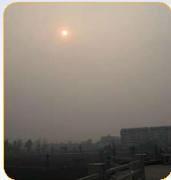
中国寿县上空的阳光被多霾天空过滤