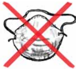
Máscara de Polvo