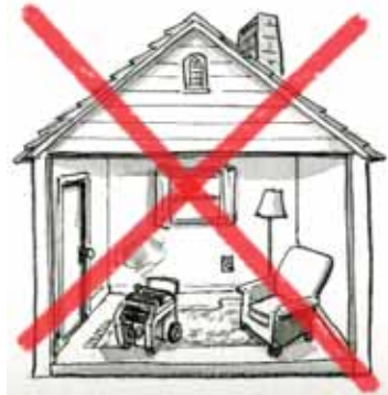
en su casa.