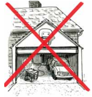
en un garage.