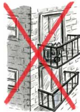
en un balcón.