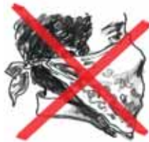
Pañuelo o Bandana

Una máscara de polvo o un pañuelo no le protegerán porque el moho puede pasar a través de ellos.