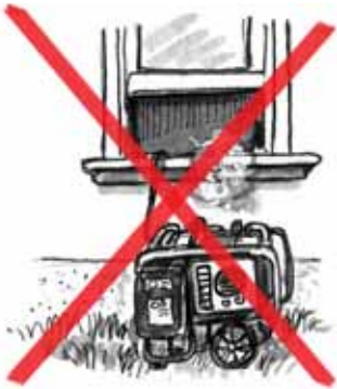
cerca de una ventana.