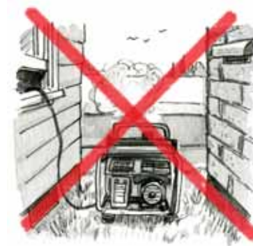
entre edificios que están ubicados muy cerca.