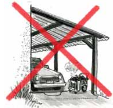
en un garage descubierto.