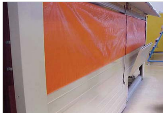
Esta casa francesa es portátil. No tiene piso pero utiliza lecho y han automatizado el equipo de alimentación.