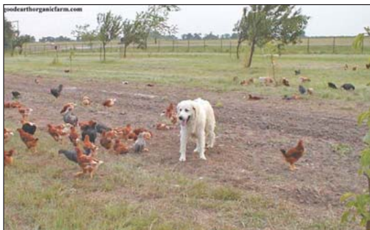
Los perros guardianes pueden proteger las aves de corral.

Para depredadores de día, como son los perros, una cerca de electronet alrededor del patio proporciona buena protección de