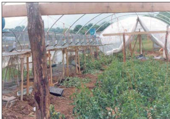
El interior del invernadero de aros de Salatin plantado con hortalizas tempraneras.

Los ciclos de enfermedad pueden romperse cuando las mismas especies no ocupan el mismo sitio todo el tiempo. Por ejemplo las ovejas pueden limpiar los parásitos que afectan a las aves en pastura. Sin embargo algunas especies de aves, (pollos, pavos, patos, etc) no deberían de estar