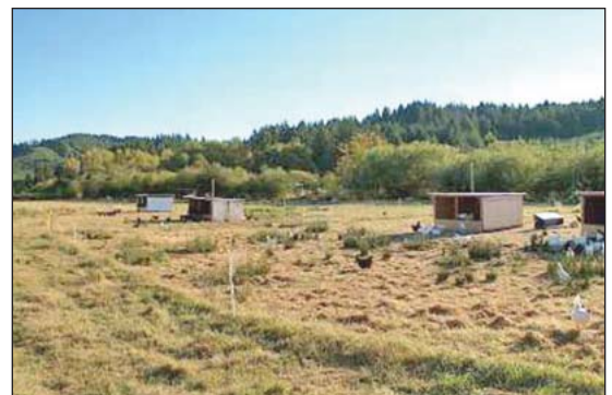
El sistema de colonia de Plamondon tiene una casa central del anidar agrupada con cuatro casas pequeñas para posar.

En la producción de colonia se usan muchas casas pequeñas junto con casa y nido común y área para dar de comer. Esta basada en un sistema que era popular en el comienzo de los años 1900 en la industria en California su centro era cerca de Petaluma. Estaba diseñada ara reducir la labor de recoger los huevos de casas