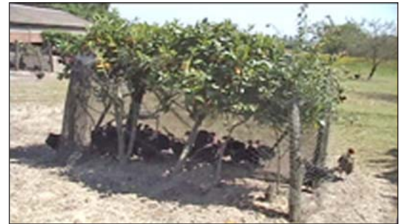
La sombra puede ser construida.