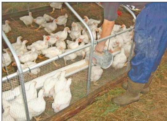
Este corral de pastura no solo se utiliza para la avicultura sino también como cajonera fría para empezar transplantes de hortalizas.