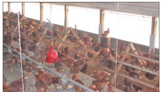
Las gallinas libres de jaulas están pueden rascar y posar en la percha.

Libres de jaula. Las gallinas ponedoras libres de jaulas se crían sueltas en el piso,