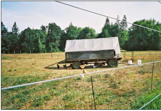
Casa con ruedas.