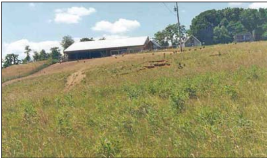
Las aves de corral pueden incluso causar la erosión.

se mueve. Las casas fijas se abren al patio para proporcionar acceso afuera, y las aves son generalmente encerradas en la casa por la noche. Este tipo de producción es hecho por la mayoría de compañías que tienen aves libres en pastura en los E.U. y es algunas veces llamada “semi intensiva.” En una escala pequeña es el familiar gallinero y patio para pollos.