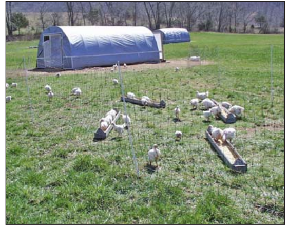
Una casa portátil de aro.

El diseño de las casas puede impactar la portabilidad. Casas portátiles generalmente tienen pisos cubiertos con lecho para proteger las aves y evitar estar en piso mojado. Los pisos aumentan la habilidad estructural para que la casa no se haga pedazos al moverla. Sin embargo, las casas sin los pisos son menos caras para construir y reducen el potencial para ser habitadas por roedores Si una vivienda portátil no tiene