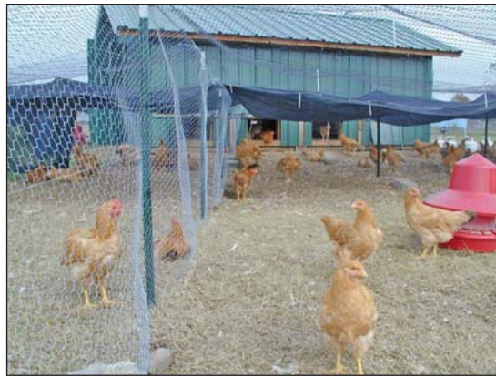
Las aves de corral necesitan comedores y agua en áreas al aire libre tan bien como en el interior.

corran de regreso a la casa cada vez que algo vuela sobre su cabeza. (2)