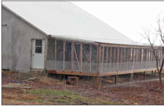
Un porche con alambra y piso de maya.