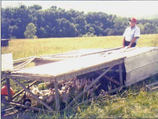
Corrales en pastura se mueven diariamente a pastos frescos.

pequeñas en el pastizal. Las “colonias” de pequeñas casas para posar en las perchas comparten una casa común para anidar y para comer. Plamondon mueve sus casas cada cuantas semanas para un lugar nuevo alrededor de 100 pies de distancia. El productor visita únicamente una casa, la casa donde anidan, para recoger huevos. El productor recoge los huevos en charolas planas para ser recogida por camioneta o ATV (o en el pasado, caballo) Según Plamondon, cuando usted tiene mas huevos de los que pueda cargar a mano, usted necesita una casa de anidar. Las casas para anidar de Plamondon, no usan pisos ni lecho, aun cuando las casas para anidar tienen lecho para limpiar los pies de las aves. Cuando el mueve la casa hay de 2 a 4 pulgadas de estiércol el cual el desparrama con su tractor y lo incorpora a la pastura. Las casas deben de estar a 300 pies de los graneros, garajes y otros lugares donde no quiere que aniden las aves. El mantiene 50 gallinas en cada casa pequeña, y sus colonias consisten de 200 gallinas cada una.