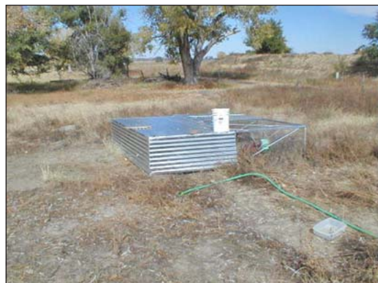
Pasturas en tierras áridas.

La mayor parte del oeste de EEUU. es tierra seca donde es difícil mantener el forraje en un estado vegetativo. Plantas tolerantes a la sequía tal como lo son el pasto anual y el pasto perenne sudan, milo, y el sorgo, pueden estar verdes durante el largo y seco verano, pero las aves pueden no gustarles tanto como otros forrajes. Mucha pastura del oeste es esencialmente heno y ofrece pocos nutrientes para las aves, sin embargo proteína viva y otros beneficios del acceso al exterior son aun importantes. Aun así los pavos son nativos de las áreas secas del sur de América del norte. Baja humedad en tierra seca reduce el peligro