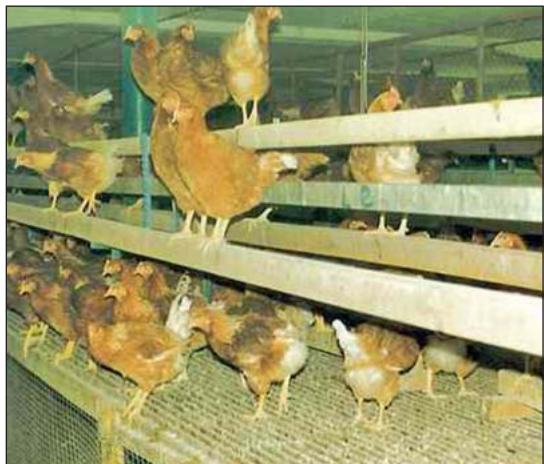
Las gallinas tienen acceso a los niveles múltiples y a las áreas para rascar en aviarios.

Los aviarios son estructuras con múltiples filas para gallinas ponedoras libres o de pastura que proveen varios niveles de pisos y usan espacio vertical (perchas y plataformas) para permitir a las aves que brinquen a diferentes niveles. Los aviarios pueden mantener una gran densidad de gallinas.