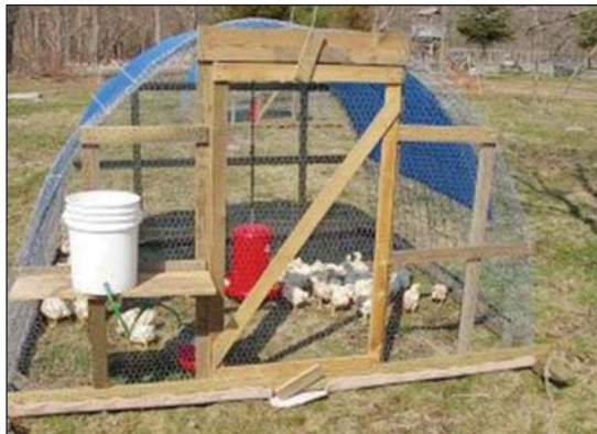
Corrales de casas de argollas son populares.

No se usa lecho así que las aves pueden forrajear por pasto y si el corral se mueve