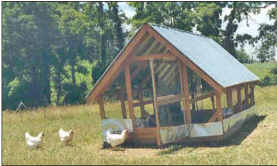
Un albergue portátil con un piso.

que los albergues con ruedas, porque puede ser difícil de arrastrar. Si rieles de madera son usadas en producción orgánica, estas no deben de ser tratadas a presión con arsénico de cobre y cromo o con otros materiales prohibidos. Ver ATTRA's Las Alternativas a Madera Tratada . Tubos de metal son otra alternativa y son mas lisas para arrastrar de lo que es la madera.