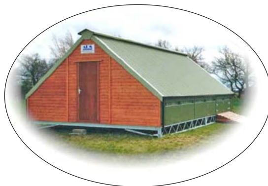
Una atractiva vivienda usada para la producción de aves libres sin cerca en el Reino Unido.