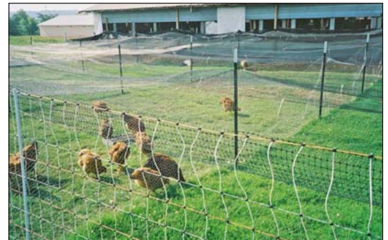
Subdividiendo la yarda de una casa fija permite la rotación y el reposo del pasto. El uso de redes contra pájaro puede reducir el contacto con las aves silvestres.

parvadas libres en pasturas han sido encerradas para evitar contacto con aves silvestres. Tome medidas para reducir contacto directo entre parvadas domesticas y las aves silvestres. Mantenga aves silvestres fuera del alcance de los comederos para que no coman o defequen en ellos. La asociación sugiere un envase con pequeñas rajaduras que permite a las aves coger solo unos cuantos granos o bolitas a un tiempo. Redes sobre las áreas reduce el contacto con la vida silvestre, y las áreas cubiertas pueden eliminar el contacto. La bio-seguridad para las aves (38) es un proyecto del departamento de USDA que proporciona información para los pequeños productores de aves en como mantener buena bio-seguridad.