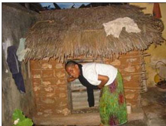
La producción adentro también es hecha en escala pequeña en los países que están en desarrollo.

Adentro. La industria convencional en escala grande cría sus pollos para asar en gallineros. Estos están elevados en el piso con lecho, usualmente a una densidad entre 6.6 a 8.5 libras por pie cuadrado (7), lo cual es menos de 1 pie cuadrado por ave.