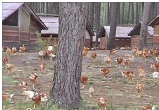
Gallinas libres en pastura forrajeando en un bosque en Francia.

revueltos, tampoco bandadas de diferentes edades. Algunas especies son portadores de enfermedades que pueden afectar a otras especies y las aves viejas pueden traer enfermedades a aves jóvenes.