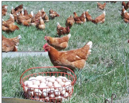
El acceso al aire libre es una parte importante de los sistemas avícolas alternativos.

La producción avícola alternativa esta creciendo debido a la demanda del consumidor para productos de especialidad de aves sin jaula y la producción de aves libres en pastura. Esta publicación discute las diferencias que hay entre sistemas de producción alternativos y convencionales. Sistemas de producción alternativos varían de acuerdo con el tamaño, pero en algunos países están normalizados por definiciones específicas para asistir en el mercadeo. Se presentan varios de los aspectos del sistema libres en pastura en los Estados Unidos y fuera del país. También se discuten los diseños de gallineros comunes. La integración de la producción avícola con la producción de cultivos en una granja diversa es una parte importante de la agricultura sostenible, y las aves pueden ser integradas en la producción de hortalizas con “tractores de gallinas” (“chicken tractor”) y con animales de pastura, como lo son las ovejas. La producción avícola orgánica es una alternativa que esta actualmente disfrutando de un mercado creciente. Las consideraciones que rodean la producción orgánica se hacen presentes. Tópicos de producción como lo son el acceso a patios o pastizales y el manejo de pastura, rotación de pastura, y control de depredadores también se tratan.