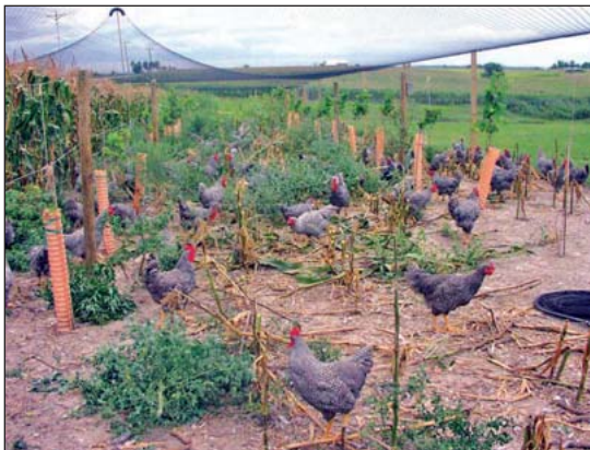
Pavos en una huerta.

llamado Tractor de Pollo (18). Las aves se guardan en pequeñas jaulas en un jardín para proveer fertilidad, cultivación, y control de insectos. Lee uso una jaula pequeña sin piso, para que las aves puedan forrajear y escarbar. La jaula esta cubierta con alambre y usualmente tiene el techo cubierto o una pequeña casa pegada. La jaula se mueve diario a lecho de barbecho para aumentar la fertilidad y aumentar el rendimiento del jardín. Los pollos también quitan las malezas, cultivan los lechos y ayudan a controlar los insectos. Los desperdicios del jardín se usan para suplementar la comida. En adición de alternar la jaula diaria a un lugar fresco, Lee sugiere dejar la jaula en un solo lugar y poner lechos de paja fresca diario para crear un semillero elevado. Moviendo la jaula después de un mes dejara una cubierta de paja sobre las camas para matar el pasto y las malezas. Según el productor Jean Nick, pollos pesados para asar realmente no cultivan la tierra. “Estos únicamente se ensucian y pisotean la suciedad” Las ponedoras son