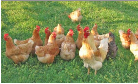
El acceso al aire libre o la producción "extensa" permite que las aves de corral expresen comportamientos naturales, proporciona luz del sol y el aire fresco, y un ambiente sano para las aves..