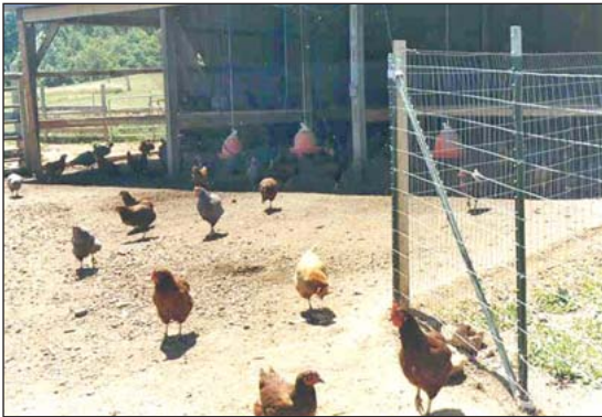
Las aves de corral dañan la vegetación en un patio permanente.