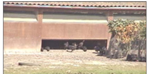
Las entradas deben ser del tamaño para que varias aves puedan salir al mismo tiempo.

gran cantidad de nutrición, hierbas, proteína viva, y protección para las aves. Elm Farm Research Centre (28) en el Reino Unido ha planeado un agro sistema para las aves con árboles, arbustos, y hierbas que promueven la salud.