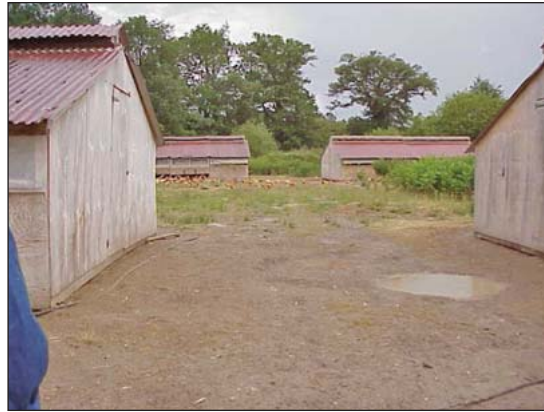
Evite las áreas bajas donde el agua se puede encharcar.

reducir la tensión pues las aves tienen más espacio. Luz del sol directa, aire fresco, y los elementos (heladas, calor, sequedad) pueden ayudar a reducir las enfermedades. Salir al aire libre puede enriquecer las vidas de las aves e incorporar su actividad como parte de los ciclos biológicos y los ciclos nutrientes. Sin embargo, si la salida al aire libre es hecha en mala forma, esta puede ser mal para las aves en lugar de ser un beneficio.