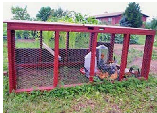
Los tractores de pollo son usados en jardines para el cultivo y control de insectos y malezas.

Un “tractor de pollo” es una manera de integrar la producción de las aves con la producción de hortalizas. Andy Lee describió su sistema en un libro popular