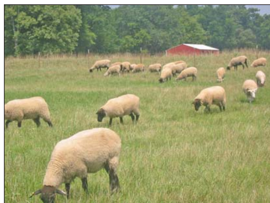
Las ovejas pueden ser integradas con las aves para controlar el forraje de las aves libres en pastura.

Diversidad en el cultivo de las granjas es una parte importante de la agricultura sostenible, y las aves pueden ser integradas con ganado, cultivos, y la producción de vegetales en los sistemas de “permacultura” que integran los principios de sistemas naturales con la agricultura. Algunos programas orgánicos requieren que por lo menos 50 por ciento de la comida de las aves provenga de granjas donde las aves son criadas o de una granja cercana para mantener los ciclos de nutrientes cerca de la misma región. Diversidad en el cultivo de las granjas permite que los nutrientes estén reciclados entre plantas y animales.