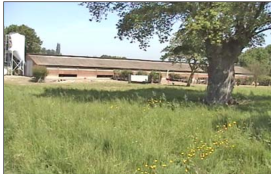
La producción libre en pastura se hace en escala grande o pequeña.

bajo ciertas circunstancias. Cuando se solicita la aprobación de una etiqueta, el productor debe de presentar una breve descripción de su gallinero, lo cual el USDA revisa para determinar que las aves tienen acceso hacia el exterior por lo menos la mitad de sus vidas. (6) en los EU, la definición de “huevos de pastura” requiere acceso al exterior con un máximo de cantidad de densidad de 1 gallina por 43 pies cuadrados (el equivalente a 1,000 gallinas por acre), y también requieren el uso de gallinero de “Granero” sistema antes mencionado. (4)