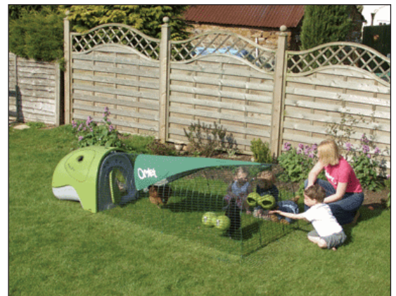
Los productores urbanos utilizan a menudo corrales pequeños unidos a las casas.

En Europa hay algunos corrales extravagantes y caros. Algunas tienen gallinero incluido. Estas “arcas” Europeas están disponibles a través de los distribuidores en los EEUU pero aun hay algunos corrales similares en los EEUU. La Henspa (16) y la Eglu (17) están disponibles para la producción urbana de aves.