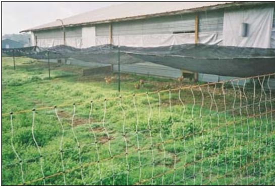
Una casa fija y un patio.