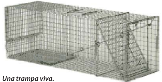
Una trampa viva.

Algunos productores atrapan los predadores vivos y pueden después matar el animal humanamente. Animales que representan algún problema pueden ser relocalizados, pero pueden ser un problema para otro productor. El siguiente website vende trapas compasivas http://pestproducts.com/humane_live_traps.htm .