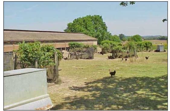
La sombra es crucial en las áreas al aire libre para las aves de corral; los campos abiertos no son hábitats preferidos.

Las aves pueden ser combinadas con árboles en un sistema agroforestal, como es una huerta o ornamentales de madera. Una variedad de árboles, arbustos, plantas bajas, y áreas desmontadas de pastura ofrecerá una