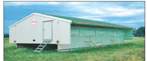
Esta casa portátil tiene una veranda en el techo con cortinas que pueden ser bajadas cuando el tiempo es frío.

Los albergues movibles con rieles son generalmente movidos menos frecuentemente