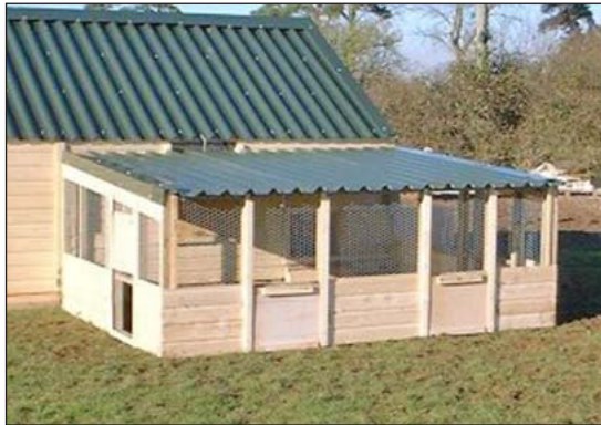
A veranda provides a transition area to free-range or a winter garden.

parcialmente o enteramente con un techo, haciendo una veranda. Mallas de alambre como cortinas pueden ser usadas para encerrar las aves en “un jardín invernal.” Esto permite acceso a luz solar, aire fresco y protege las aves del mal tiempo y depredadores. Un porche cerrado y con piso de malla permite al estiércol que pase y pueda ser recogido y retirado.