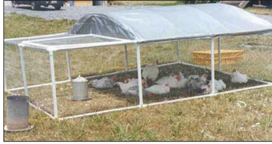
Un corral construido de tubo de plástico.

pequeñas en el pastizal. Las “colonias” de pequeñas casas para posar en las perchas comparten una casa común para anidar y para comer. Plamondon mueve sus casas cada cuantas semanas para un lugar nuevo alrededor de 100 pies de distancia. El productor visita únicamente una casa, la casa donde anidan, para recoger huevos. El productor recoge los huevos en charolas planas para ser recogida por camioneta o ATV (o en el pasado, caballo) Según Plamondon, cuando usted tiene mas huevos de los que pueda cargar a mano, usted necesita una casa de anidar. Las casas para anidar de Plamondon, no usan pisos ni lecho, aun cuando las casas para anidar tienen lecho para limpiar los pies de las aves. Cuando el mueve la casa hay de 2 a 4 pulgadas de estiércol el cual el desparrama con su tractor y lo incorpora a la pastura. Las casas deben de estar a 300 pies de los graneros, garajes y otros lugares donde no quiere que aniden las aves. El mantiene 50 gallinas en cada casa pequeña, y sus colonias consisten de 200 gallinas cada una.