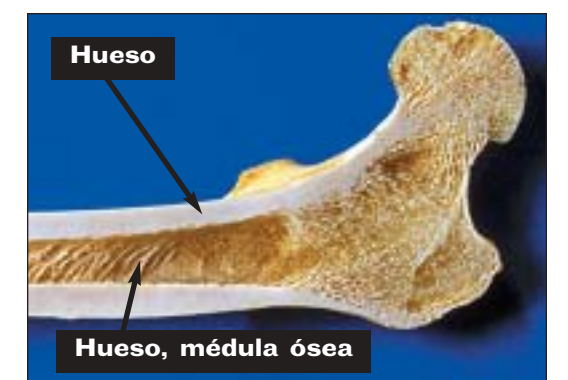
Hueso, médula ósea

Los inhalantes afectan a la médula en el interior de los huesos.