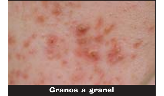
Granos a granel

Los esteroides pueden causar granos de acné por toda la cara a las personas que los usan.