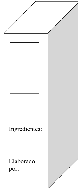
Panel de Información

Existen varios reglamentos que determinan los requisitos que aplican al etiquetado de alimentos. Todos los alimentos empacados para venta al público tienen que estar etiquetados adecuadamente. Existen 5 áreas de requisitos obligatorios que deben incluirse en las etiquetas.