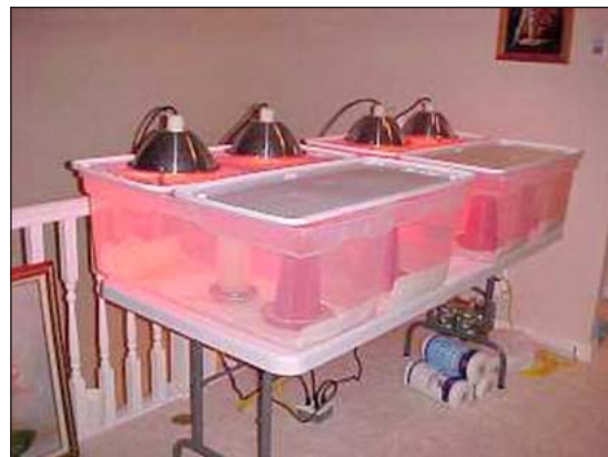
Lámparas de calor.

Lámparas de calor. Muchos pequeños productores avícolas usan incubadoras de