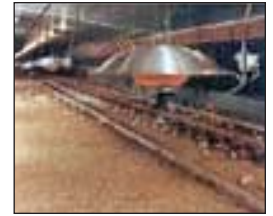
Calentadores incubadoras grandes de propano.

Bebederos y comederos del tamaño de los pollitos son usados durante la incubación, porque los pollitos pueden caerse dentro de los bebederos y enfriarse. La comida debe de proporcionarse en el piso en una cacerola no profunda para que los pollitos la encuentren fácilmente. Sumergiendo los picos de algunos de los pollitos en agua y comida los ayudara a aprender pronto a comer y a beber, y los otros pollitos los imitaran. Cuando coloquen a los pollitos en la incubadora proporcione 24 horas de luz para ayudar a los pollitos a encontrar comida. Periodos oscuros pueden añadirse después de unos días. “Hambrientos” son aquellos pollos que no han aprendido a beber y a comer. Los pavos, en particular, son susceptibles a esto, así como a tensión y enfriamientos. Suplementos de Electrolitos pueden agregarse al agua si los pollos han sufrido tensión durante embarque. El azúcar es también útil para proporcionar energía. Según Plamondon, la cantidad es una libra de azúcar por un galón de agua, lo cual es aproximadamente de la misma dulzura que Kool-Aid. Otros productores han usado una cucharada grande de vinagre de cidra de manzana y una cucharadita de melaza para un galón de agua. Suplementos en el agua son útiles el primer dia porque los pollitos encuentran la comida después de esto. Los suplementos necesitan ser orgánicos si la parvada es certificada orgánica.