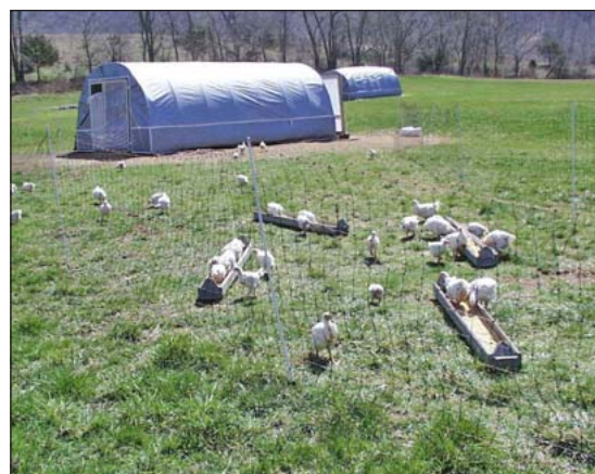
Producción avícola alternativa usualmente incluye el acceso al aire libre.