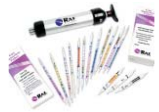
Los niveles de amonio pueden ser medidos con tubos detectores de gas. www.raesystems.com

Tratamiento para los lechos se agrega en la industria convencional avícola a la paja re-usada para reducir la formación de amonio del nitrógeno bajando el pH. El pH típico de los lechos de paja es entre 9 y 10. (9) El escape de amonio es bajo cuando el medio ambiente es ácido (pH es menos de 7). Un pH bajo también puede impedir los microorganismos, incluyendo bacteria