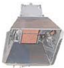
Pequeños calentadores incubadoras infrarrojos.

Los cernerros se coloca en el piso arriba de las aves. En su website ( www.plamondon.com ), Plamondon describe un cernero en forma de caja que esta aislado y calentado por lámparas eléctricas. Fue desarrollado en los años 1940's por la Estación Experimental de Ohio y fue muy popular con