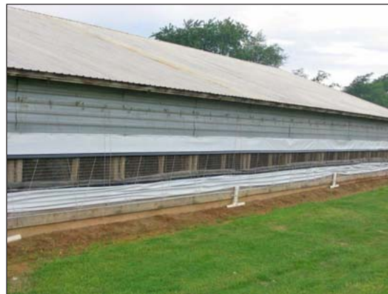
Las cortinas pueden ser bajadas para proporcionar ventilación natural.

dependen de ventilación natural, porque las puertas generalmente están abiertas para proporcionar acceso al exterior. Ahí puede haber entradas de aire adicionales, cortinas a un lado, o ventanas grandes que pueden ser abiertas para permitir más ventilación en tiempo de calor. Las ventilas de caballete en el techo o las ventilas del “ventilador rotativo” permiten que el aire caliente escape. Ventilación natural hace uso del movimiento de aire (el aire caliente sube y el aire frió baja) y las corrientes de viento. Un techo de por lo menos de seis pies de altura en que el aire frió entre a través de aperturas bajas y que el aire caliente escape