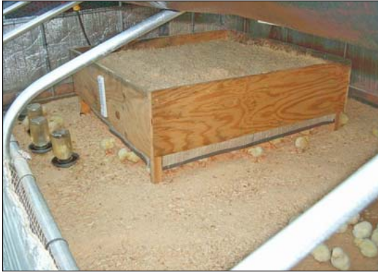
Un cernero usado en un corral de campo.

bandadas pequeñas. Fue diseñada para incubar bajo condiciones de granja, en graneros con corrientes de aire y en gallineros portátiles en pasturas. Puede ser aislada agregando paja por encima o agregando empaque de burbujas aluminizado (Tek-foil®) a dentro. Para mas información, Ver Plamondon's Success with Baby Chicks . (12) El Productor Bob Fenrich usa este cernero eléctrico en el campo con cortinas de Tek-foil® las que el coloca dentro de un corral forrado de pastura.