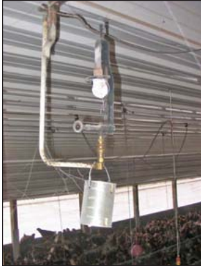
Luces de kerosén en una casa grande para aves sin electricidad.