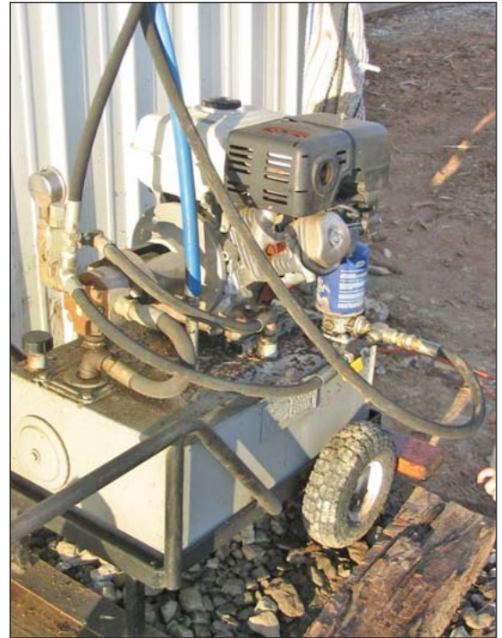
Un motor hidráulico a fuerza de gas que dispensa alimento dentro de una casa sin electricidad.

Mientras que pequeños gallineros portátiles no usan energía, la electricidad segura es importante en gallineros grandes para dar fuerza a los sistemas de ventilación, luces, calefacción, comederos automáticos, etc. La mayoría de los ranchos tienen electricidad, pero generadores de diesel pueden ser usados para dar energía a un