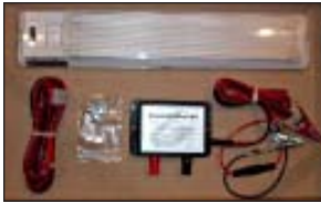
Un sistema de alumbrado de 12 volts para pequeños gallineros. www.roosterbooster.co.uk