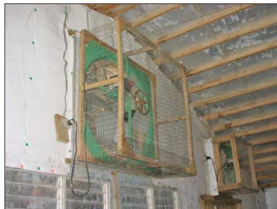
Los abanicos pueden ayudar a sacar el aire y humedad de la casa.