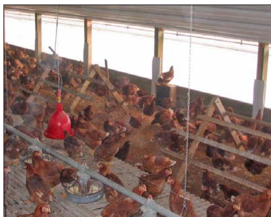
El área de adentro es tan importante como el área de afuera para la producción de aves libres en pastura.

Mientras que el acceso al exterior es una parte importante del sistema libre en pastura y muchos otros sistemas de producción alternativa de avicultura, el medio ambiente interior y su manejo es crítico. Las aves necesitan acceso a un medio ambiente apropiado en el interior para buena producción y bienestar. Idealmente las aves deberían escoger un medio; ya sea dentro o fuera. Es necesario dar atención a la ventilación, temperatura, luz, y condición del lecho. Adicionalmente buenas prácticas de manejo incluyen control de roedores con un mínimo uso de materiales tóxicos. La producción alternativa de avicultura es frecuentemente a una escala pequeña con casas portátiles. La producción también puede ser certificada orgánica. Prácticas especiales pueden ser necesarias comparadas con la avicultura convencional. La avicultura alternativa es una manera de aumentar los ingresos del rancho, mientras se proporcionan productos especiales de la avicultura a los consumidores como parte de la agricultura sostenible.