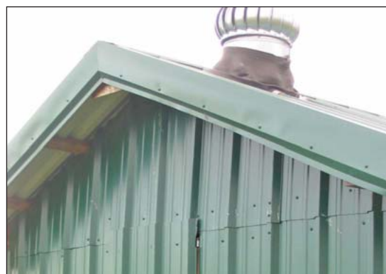
Esta pequeña casa móvil tiene una entrada de aire al fin de la pared y una ventila en forma de abanico rotativo en el techo para permitir que el aire y la humedad escapen.