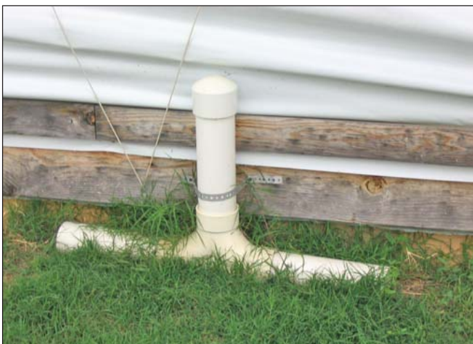
Tubos de PCV con el cebo colocado adentro pueden colocarse en el interior o exterior. Las estaciones ayudan a prevenir que animales no objetos se acerquen a el cebo.

Además del acceso afuera, es importante un medio ambiente apropiado interior para la producción alterna avícola. Atención a buena ventilación, iluminación correcta, lecho y calidad de aire le ayudara a mantener el funcionamiento mientras les proporciona el bienestar.