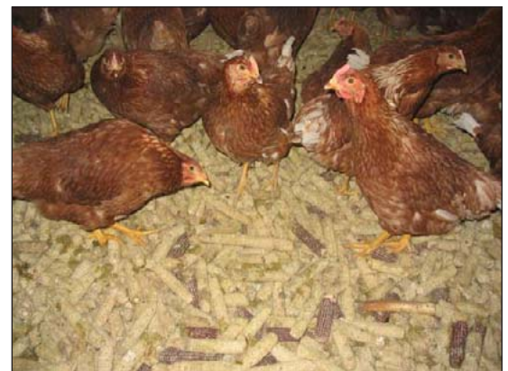
Lecho de Mazorcas

El manejo del lecho es muy importante en la mayoría de los sistemas de producción de avicultura. Los pisos en gallineros son generalmente de concreto, madera o un piso de tierra, y paja o viruta se usa para cubrir el piso. La paja o viruta diluye el estiércol y absorben humedad proporcionan acolchado y aislamiento para las aves, y captan nutrientes para esparcir afuera a donde se desee. El lecho también es un medio para que las aves rasquen y es importante para su bienestar. Las aves también se crían en un piso enrejado de tablillas en el cual los desechos caen abajo donde se retiran. Manteniendo los desechos secos reducirá el olor y las moscas.