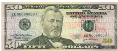
2004年 — 新版50美元钞票新增蓝色和红色以及美国国旗图案。