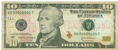
2006年 — 10美元钞票带有橙色、黄色和红色以及自由女神的火炬图案。