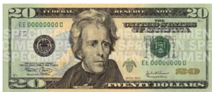
2003年 — 新版20美元钞票新增绿色、桃色和蓝色以及美洲鹰图案。