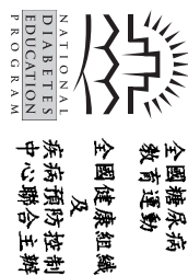
2 1/16"x5 1/4"