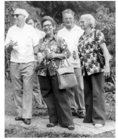
On BCI. En Barro Colorado

sigue adelante en las décadas siguientes. La biología tropical y la educación superior en las Américas son las constantes beneficiarias de sus raras virtudes."