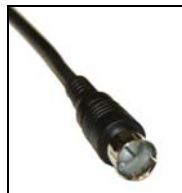
کابل کوآکسیال (هم محور)

وسایل مورد نیاز: شما به یک تلویزیون آنالوگ، دستگاه ضبط و پخش ویدئو، آنتنی که استفاده می کردید (آنتن داخل منزل یا روی بام)، و کابل کوآکسیال که آنتن را به دستگاه ویدئو متصل می سازد (شکل سمت چپ)، نیاز خواهید داشت. همراه باکس کانورتوری که تهیه نموده اید، یک کابل کوآکسیال و یک ریموت کنترل است. پیش از شروع به نصب، باید تلویزیون و ویدئوی خود را از برق خارج نمایید.