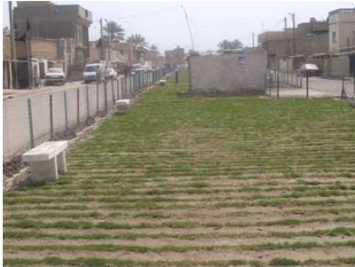
الحديقة قبيل و بعد التنظيف و التشجير.

تخد العيادة عشرة الاف من الناس في المنطقة الا انها تنقر الى المعدات الطبية المتطورة و كانت تعاني من اهمال شديد . مما ارغم العديد من السكان المحليين الى الاعتماد على المركز الصحي و ذلك بسبب كون اقرب الخدمات الطبية بعيدة . و مع هذه التحسينات سيتمكن سكانا لمنطقة من الاعتماد على مركز طبي مجهز جيداً و يعمل بصورة فاعلة .