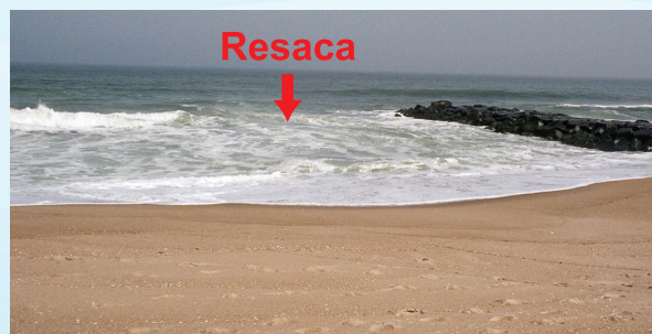
Con frecuencia la resaca se origina cerca de ciertas construcciones costeras.