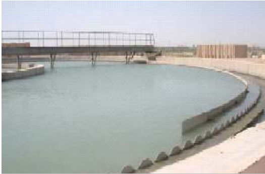
يقوم مشروع النجف لمعالجة المياه بتوفير الماء الصالح للشرب الى أغلبية 563,000 مواطن من سكان المدينة.

تستمر عملية تنصيب انابيب التعقيم في محطة النجف لمعالجة المياه ، وتعمل الآن جميع مضخات الرفع العالي وسبع مضخات ذات الرفع الواطي في المحطة وبقيت مضخة واحدة للرفع الواطي في حالة تقدم بالعمل . كذلك تم ايضاً تنصيب مضخات التوزيع ومضخات ملئ الخزانات ، ويستمر التدريب على التشغيل والصيانة في الموقع في الاسبوع الماضي وتم اكمال ساعات التدريب ضمن وقت العمل ، واخيراً كان هناك تمارين متزامنة لمولدات الطوارئ الثلاثة 1 ميغواط في هذا الاسبوع ، ومن المفروض ان تبدأ المحطة بالعمل بسعتها التامة في بداية شهر شباط 2005 .