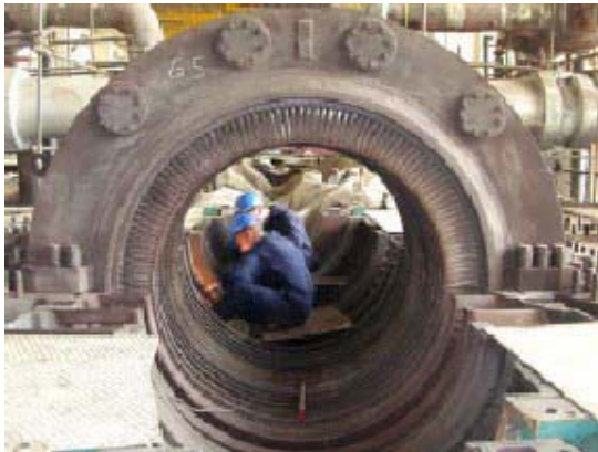
يتقدم العمل في الوحدة رقم 5 لمحرك الضغط العالي.

يقوم هذا المشروع بترميم وحدتي انتاج المحرك البخاري رقم 5 و6 لمحطة الطاقة الكهربائية. حيث ان نظام السيطرة لمحركات ومرآجل الوحدتين قديم جداً ولا يمكن استخدامه وتتطلب الوحدتين جهد كثيف قبل ان يتم تشغيلها في تصميم الانتاج ، وقد تم