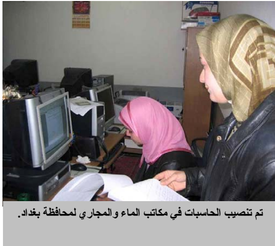
تم تنصيب الحاسبات في مكاتب الماء و المجاري لمحافظة بغداد.

اشرف كادر برنامج الحكم المحلي في وسط جنوب العراق على اقتناء و تحويل الاثاث الى خمسة مكاتب اقسام زراعية في انحاء محافظة القادسية. كما اشرف الكادر ايضاً على تنصيب بنى تحتية للانترنت في مكاتب الاقسام الزراعية من اجل تزويد المزارعين بالقدرة لاستخدام الانترنت للاطلاع على التقنيات و الاستراتيجيات الزراعية الحديثة .