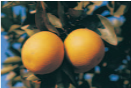
Toronjas del Valle del Rio Grande