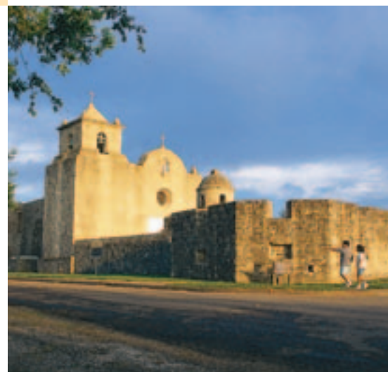
The Presidio la Bahía, Goliad.

San Antonio, colmada de historia y tradición, recibe a unos 20 millones de visitantes todos los años. Es seguro que la mayor parte visita el legendario Álamo, donde una pequeña banda de rebeldes murió en una batalla desesperada para independizar a Texas de México. Los visitantes pueden aprender acerca del fascinante pasado de San Antonio, desde la historia colonial española en el Palacio del Gobernador español y la Catedral de San Fernando hasta la historia militar en el museo Fort Sam Houston Museum. Las exquisitas colecciones de arte del museo San Antonio Museum of Art, alojado en el llamativo edificio de la cervecería Lone Star Brewery, construido en 1884, y del museo McNay Art Museum, uno de los primeros museos de arte moderno en Texas, muestran muchos tesoros culturales. La familia puede pasar unas vacaciones encantadoras en San Antonio, visitando al extraño y maravilloso museo y taberna