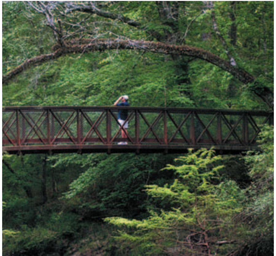
Big Thicket National Preserve, cerca de Woodville.

Día 2 Viviendas históricas elegantemente restauradas y una agraciada hospitalidad confieren a Jefferson la atmósfera del Sur estadounidense. Después de visitar los lujosos vagones que solían llevar al millonario Jay Gould por todo el país, diríjase al cercano parque Caddo Lake State Park. Participe en una excursión informativa en pontón alrededor del lago para orientarse, o vaya de pesca o a pasear en canoa con un guía local.