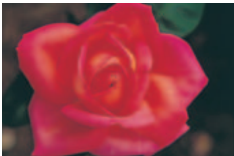
Una de las miles de rosas de Tyler.