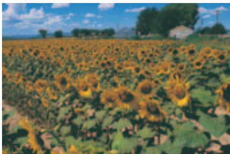
Cultivo de girasoles, Panhandle de Texas.