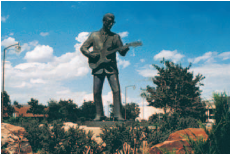
Buddy Holly Memorial, Lubbock.

Día 1 Amarillo se hizo famoso en la décadas de 1950 y 1960 como parada en la carretera Old Route 66, restaurada con tiendas históricas y carteles de neón en la calle Sixth Street entre las calles Georgia y Western. Una de las atracciones más recientes de la ciudad es el museo Kwahadi Kiva Indian Museum, que brinda una colección exquisita de arte indígena norteamericana, así como espectáculos por los famosos bailarines Kwahadi Dancers. A los niños les encantará el centro de descubrimientos Don Harrington Discovery Center, que agregó un nuevo teatro espacial digital en 2003, que lleva a los espectadores más allá del planetario típico a una experiencia plena de sonidos y vistas. Antes de partir, casi todos hacen el peregrinaje al lugar donde se encuentran 10 Cadillac semienterrados, conocido como Cadillac Ranch, apenas al oeste de la ciudad en la carretera I-40.