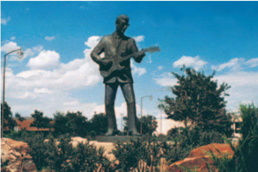
Buddy Holly Denkmal, Lubbock.

Tag 4 Amarillo wurde in den Fünfziger und Sechziger Jahren als Stopp entlang der Old Route 66 bekannt. Alte Geschäfte mit Neonreklame säumen die restaurierte Sixth Street zwischen der Georgia und Western Street. Eine der neuesten Attraktionen der Stadt ist das Kwahadi Kiva Indian Museum, in dem eine exklusive Sammlung indianischer Kunst ausgestellt ist. Auch werden hier Aufführungen von den bekanntesten Kwahadi Dancers geboten. Den Kindern wird es im Don Harrington Discovery Center gefallen, dem 2003 das neue Digital Space Theatre hinzugefügt wurde. Hier wird den Zuschauern neben den typischen Attraktionen des Planetariums ein spektakuläres Audio- und Video-Erlebnis geboten. Und bevor Sie die Stadt verlassen, sollten Sie einen Besuch der als Cadillac Ranch bekannten zur Hälfte eingegrabenen 10 Cadillacs, die westlich von der Stadt an der I-40 zu sehen sind, keinesfalls versäumen.