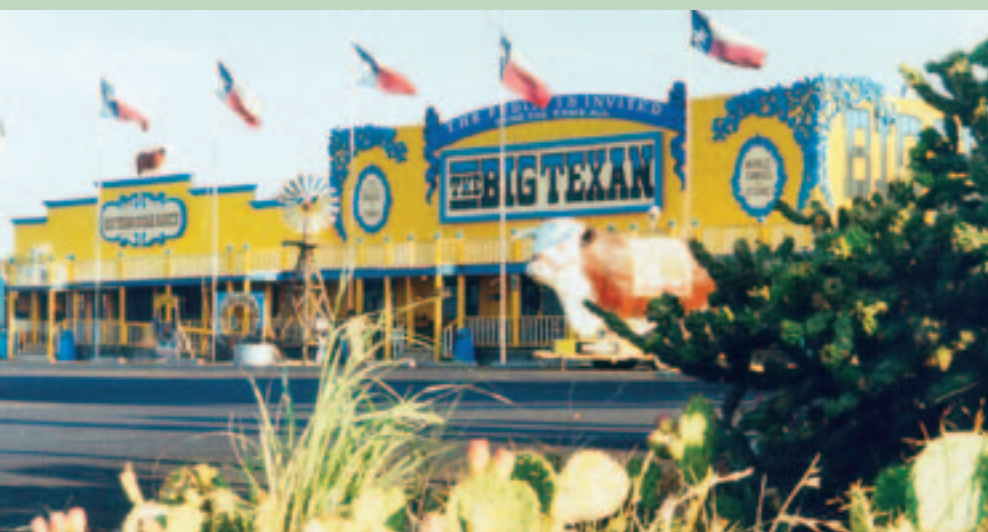
Die Big Texan Steak Ranch und Hotel, Amarillo.

Dies ist ein großes kommerzielles Unternehmen im Ranch-Stil. Über 100.000 Rinder wechseln jährlich auf dieser Viehauktion, einer der größten in Texas, den Besitzer. Gleich daneben, im Stockyards Café, werden Helfer und Geschäftsleute mit herzhafter Kost bestens versorgt. WC ♿