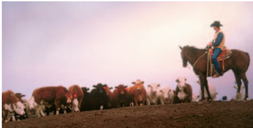
Panhandle ranch, Amarillo.

3121 Fourth St., Lubbock, 79409 806-742-0498, nrhc.ttu.edu Die 38 sorgfältig restaurierten authentischen Ranchstrukturen auf diesem 6 Hektar (16 Morgen) großen Gebiet, die vor-