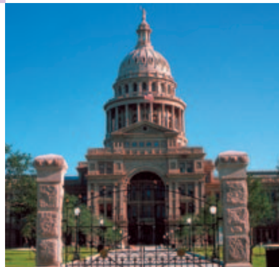
Texas State Capitol, Austin.

TX Hwy. 290 zwischen Fredericksburg und Stonewall 830-990-1393, 800-848-0078, wildseedfarms.com Vertiefen Sie sich in die wunderbare Welt der Wildblumen in diesem 101 Hektar großen Zentrum. Während der Blütezeit können Sie auf Spazierwegen Ihren eigenen Feldblumenstrauß mit dazu vorgesehenen Blumenarten pflücken oder inmitten der Blütenpracht im Pavillon ein Picknick genießen. Auf dem Markt werden Wildblumen und Kräutersamen zum Verkauf angeboten. Ein Souvenirladen ist mit allen möglichen blumenverzierten Artikeln, Wein aus Texas und kulinarischen Spezialitäten gefüllt, und Sie finden sogar landwirtschaftliche Erzeugnisse der Saison. WC ♿