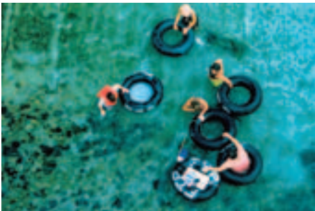
Auf einem Fluss im Bergland.