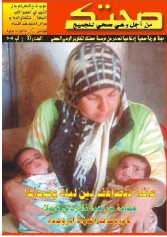
المجلة الصحية العراقية الجديدة والتي تساعد على تحديث خدمات الرعاية الصحية في العراق.

قامت احد المنظمات غير الحكومية NGO المتخصصة مؤخرا بنشر طبعتها السادسة من مجلتها التي تخص الرعاية الصحية بدعم من برنامج مبادرة الانتقال في العراق ITI. حيث بعد سقوط النظام السابق كانت المنظمة تعاني من اجهزة قديمة وممارسات خاطئة وحاليا من خلال المجلة يتم توفير المعلومات الحديثة لموظفي الرعاية الصحية وعامة الناس في عموم وسط العراق ، وخلال ثلاثة اشهر قامت المنظمة غير الحكومية بنشر 6,000 نسخة لتوزيعها الى العيادات والمستشفيات والمخازن وتم ايضا بيع اعلانات والتي نتج عنها دخل كافي للاستمرار بالنشر بعد انتهاء المنحة ، وتصل المجلة الى حوالي 4,000 مواطن بأنظمة والتي تساعد على تحديث خدمات الرعاية الصحية في العراق ، وقد نجحت المجلة ايضا في عرض الممارسات الى عامة الناس بقوة وبحرية الكلام .