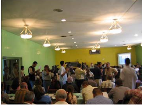
حضر اعضاء من جمعيات الاعمال التجارية العراقية الى محاضرات عن عضوية اشترك العراق في منظمة التجارة العالمية.

الاستثمار واسواق الاموال والخصخصة والسياسة التجارية .