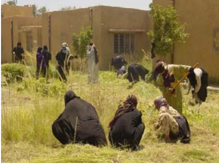
: تم مؤخرا تقديم وظائف مؤقتة الى النساء المرحلات من خلال مشروع تنظيف احد الجامعات الرئيسية في شمال العراق.

أنهت احد المنظمات غير الحكومية المحلية NGO وشركاء مكتب مساعدات الكوارث الخارجية OFDA عملية اعادة التأهيل في احد الجامعات الرئيسية في شمال العراق وتوظيف 160 من النساء المرحلات والفقيرات في هذه العملية. حيث قامت النسوة بطلاء الجانب الخارجي من مبنى الجامعة وجمع النفايات من الباحة الخارجية وتنظيف اقسام الصفوف والحمامات وتنظيف طرق المشاة الخارجية وزراعة الحديقة ، ويقدم المشروع فرصة الى النساء المرحلات الفقيرات والذين يعملن من اجل عوائلهن بدخل قصير الامد ، اضافة