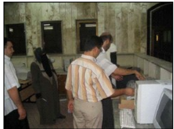
عملية اعمار البنى التحتية في احد الجامعات في شمال العراق .