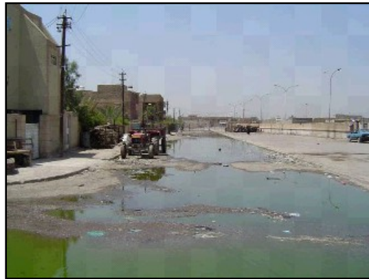
الماء الملوث المتسرب عبر شوارع مناطق بغداد.

كانت اقسام معالجة المياه والمجاري تعمل بأقل من قدرتها الكاملة بسبب سنوات من الإهمال والعجز في الطاقة الكهربائية وعمليات السلب والسرقة التي تلت الحرب ، وقد تم ضخ الماء الغير معالج للاستهلاك من خلال النظام بينما تم تدفق المجاري الغير معالجة مباشرةً خلال شوارع المدينة والانهار والاهوار ، اضافة الى ان العديد من المناطق الريفية غير مربوطة بأنابيب المياه والمجاري الرئيسية ولا يصل اليها الماء الصالح للشرب وتعاني من المشاكل الصحية المتعلقة بضعف امكانية التخلص من المجاري . ان هدف الوكالة الامريكية للتنمية الدولية USAID هو تحسين كفاءة وقدرة اقسام معالجة المياه والمجاري الموجودة وخصوصاً تلك التي في الجنوب حيث كمية ونوعية الماء فيها منخفضة بشكل خاص ، ومن المتوقع ان الفائدة ستعود على 11.8 مليون مواطن عراقي من مبلغ $ 600 مليون دولار للوكالة الامريكية للتنمية الدولية الى مشاريع الماء وتعزيز الصحة العامة .