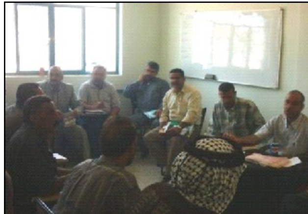
اجتماع احد مجالس المناطق في محافظة القادسية.

بعد سنوات من الظلم ، يضع العراقيون القواعد الاساسية لحكومة وطنية ديمقراطية . و يعد الحكم المحلي القوي فعالا حيث انه يشجع مشاركة المواطنين و النقاشات الحرة و يقدم الخدمات الاساسية بصورة افضل . تتضمن مشاريع الوكالة الامريكية للتنمية الدولية في مجال الحكم المحلي الارتقاء بمستوى المشاركة المتنوعة للمواطنين كمثلثين في مجالس الاقضية و البلديات و المجالس المحلية في عموم القطر لتقوية المهارات الادارية و قابلية الادارات المحلية و الهيئات الممثلة المحلية المؤقتة و المؤسسات المدنية و ذلك لتطوير عملية توصيل خدمات البلدية الاساسية و رفع مستوى المشاركة الفعالة لمنظمات المجتمع المدني و تقديم الحلول للصراعات و المهارات القيادية .