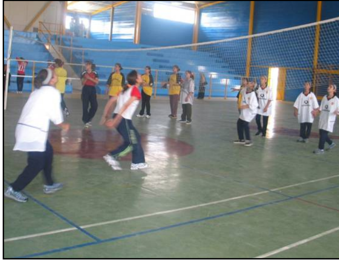
التصفيات الرياضية في محافظة واسط.

تلبى الوكالة الامريكية للتنمية الدولية الاحتياجات الاساسية للمجتمع و تشجع مشاركة المواطنين خلال برنامج النشاط المجتمعي و الذي يعمل على شتى المستويات في الريف و المدينة و يعمل على التوعية بالديمقراطية و تجنب الصراعات و تقليبها و تقليب التفرقة تبعاً للجنس و العرق و المذهب و الدين. و بالعمل المباشر من خلال المنظمات غير الحكومية الشريكة في المجتمعات مع ممثلين الحكم المحلي فان الوكالة الامريكية للتنمية الدولية توفر ممثلين و مجاميع اجتماعية مساهمة و ذلك لتحديد الاولويات الضرورية و تنفيذ البرامج لتلبية هذه الاحتياجات.