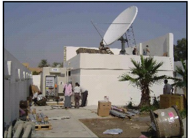
موقع للاتصالات في بغداد .

قبل الحرب كان عدد المشتركين 1.2 مليون مواطن عراقي بخدمة الخطوط الهاتفية الارضية وكانت معظم شبكات الاتصالات العراقية متمركزة في بغداد ، وقد تضرر جزء كبير من مكونات بدالات الشبكات اثناء الحرب وانقطعت الخدمة عن المواطنين ، وكجزء من جهود الوكالة الامريكية للتنمية الدولية USAID لاعادة البنى التحتية الحرجة تعمل الوكالة الامريكية للتنمية الدولية USAID مع الشركة العامة للاتصالات الهاتفية والبريد (ITPC) لاعادة شبكة الاليف البصرية الوطنية واصلاح نظام بدالات الهواتف في بغداد واعادة عمل قدرة الاتصالات الدولية .