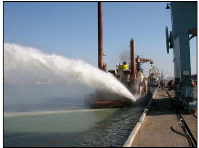
كراء في ميناء ام قصر الذي تم اعادة تأهيله من قبل الوكالة الامريكية للتنمية الدولية USAID.

ستسمح اعمال الميناء الفعالة بوصول الغذاء والمساعدات الانسانية ومواد اعادة الاعمار والمسافرين بأمان ، حيث ان اعادة تأهيل النقل والمواصلات هي الخطوة الاولى في توفير المساعدات وبدأ النمو الاقتصادي وبذلك يتم السماح بالتصدير والاستيراد ونقل المواطنين للمساعدة في اعادة ربط العراق بالعالم .