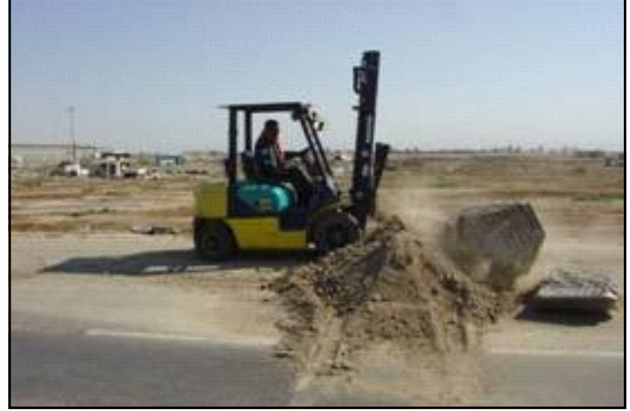
عملية اعادة اعمار طرق مطار بغداد الدولي.

تشكل المطارات الدولية والمحلية ارتباط مهم لكل من العراق وبقية الدول في العالم ، ويتم استلام المساعدات الانسانية والتجهيزات والشحن والمسافرين للتأكد من الطيران الجيد وخدمات المسافرين وذلك مهم لاسباب تتعلق بالعمل ولاسباب رمزية ليتم اعادة عمل المطارات في عموم العراق بسرعة الى الخدمة .