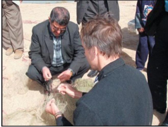
فريق التقييم يقيس و يفحص جريان الماء في الاهوار العراقية.

• في التسعينيات ، دُمرت الاهوار العراقية و هي احدى اكبر التجمعات المائية في العالم حيث تم تجفيف الاهوار و قل تنوع الكائنات الحية فيها و تم ترحيل السكان المحليي عنها . تعمل مبادرة الوكالة الامريكية للتنمية الدولية ذات الـ 4 مليون دولار مع السكان المحليين على دعم مشروع استعادة لاهوار و تطوير المجتمع في الاهوار اجتماعياً و اقتصادياً .