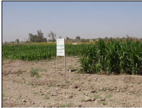
: الزراعة التجريبية لمحصول الذرة الصفراء المهجنة: تم زراعة الأنواع المحلية على اليسار و الأنواع المستوردة على اليمين ، حيث زرعت في نفس الوقت .

لقد تدهورت الزراعة نتيجة لسنوات من سياسة الحكومة المتعسفة و الحروب، حيث ان انخفاض انتاج المزارع لا يمكن ان يوفر مصدر غذائي يعتمد عليه للمدن و السكان في المناطق الريفية . اكثر من نصف المتطلبات و الحاجات الغذائية في العراق يتم استيرادها كما يعتمد نسبة كبيرة من السكان على الحصص الغذائية التي تقدمها الحكومة كمصدر غذائي. و لاعادة تاهيل البنى التحتية الزراعية و زيادة الانتاج و استعادة الخدمات عملت الوكالة الامريكية للتنمية الدولية بالتعاون و التنسيق مع الوزارات العراقية و القطاع الخاص و معاهد و مؤسسات التعليم العالي لاعادة احياء الانتاج الزراعي و توفير فرص عمل و مصدر للدخل و مبادرات عناية بالمناطق الريفية و اعادة تاهيل المصادر الاساسية الطبيعية .