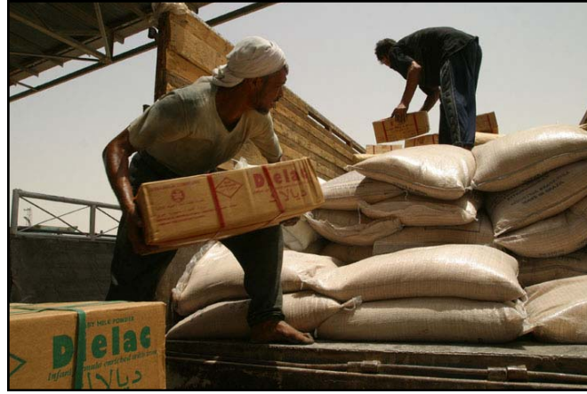
العمال وهم يحملون المواد من مخازن البرنامج العالمي للغذاء في ام قصر للتوزيع الى وكلاء التغذية في القطر. تدعم الوكالة الامريكية للتنمية الدولية البرنامج الذي يوفر المواد الغذائية للعوائل المحتاجة في جنوب العراق .

كجزء من الخطة الامريكية للمساعدة تلعب الوكالة الامريكية للتنمية الدولية دوراً اساسياً في المساعدة في تجاوز الكوارث الانسانية في العراق من خلال توفير المساعدة للامم المتحدة و برنامج الغذاء العالمي و كذلك من خلال مكتب الوكالة الامريكية الغذاء مقابل السلام . و بعد تجاوز الازمة الغذائية بعد الحرب مباشرة ، يستمر مستشارين الوكالة الانريكية للتنمية الدولية في المساعدة في ادارة و توزيع المواد الغذائية على الشعب و هذه مهمة اساسية حيث ان 60% من العراقيين قبل الحرب كانوا يعتمدون بصورة اساسية على الحصة الشهرية كمصدر غذائي و اكثر من 80% كانوا مهدين بمجاعة في حالة انقطاع الحصة التموينية .