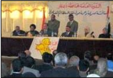
اجتماع محلي في الناصرية لمناقشة معنى عملية الانتقال الديمقراطي والدستور الجديد.