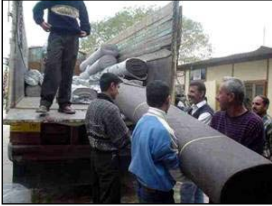
توصيل الاثاث الى مكاتب الحكم المحلي في كركوك (محافظة التأميم).