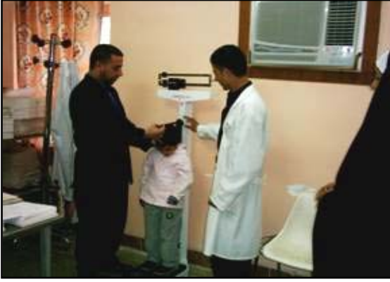
تم توصيل معدات الرعاية الصحية الأساسية الى مستوصف الاندلس الواقع في الرمادي (محافظة الانبار).