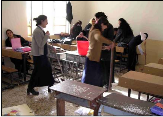
مجموعة من الافراد في منطقة الكرادة في بغداد يساهمون في اعادة تأهيل مدرسة الشرقية التقنية للبنات.

برنامج النشاط المجتمعي - - تتضمن مشاريع وكالة التنمية الدولية الامريكية في مجال برنامج النشاط المجتمعي الارتقاء بمستوى المشاركة المتنوعة للمواطنين كمثلين بين التجمعات في جميع انحاء العراق لتشخيص أسبقية توصيل الاحتياجات الضرورية الى المجتمع تنفذ سلطة الائتلاف المؤقتة CPA برنامج النشاط المجتمعي من قبل خمس منظمات غير الحكومية الامريكية مع مكاتب لها في تسعة مدن رئيسية ، كل منظمة تركز على منطقة معينة في العراق : مؤسسة التنمية الزراعية ومتطوعي ما وراء البحار ACIDI/VOCA (الشمال) ومؤسسة المساعدات الدولية والتنمية IRD (بغداد) و مؤسسة الاسكان التعاونية الدولية CHF (وسط وغرب الجنوب) وفيلق الرحمة Mercy Corps (وسط وشرق الجنوب) واتحاد انقاذ الاطفال Save the Children (الجنوب) .