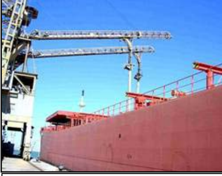
عملية تفريغ سفينة في قسم استلام الحبوب في ميناء ام قصر.