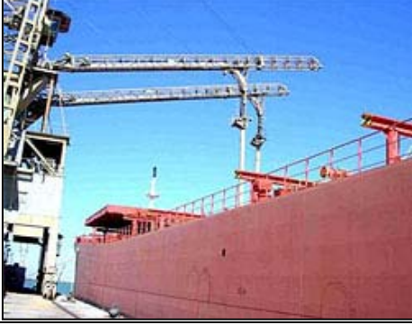
عملية تفريغ سفينة في قسم استلام الحبوب في ميناء ام قصر.