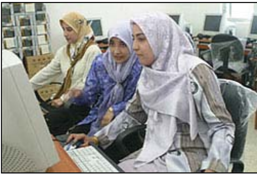
نساء عراقيات يتدربن على الحاسوب في مركز فاطمة الزهراء لحقوق الانسان في الحلة .