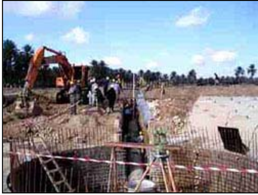
عمال يقومون بتحديد الوضع المتوازي لأنبوب تدفق المصفى في مشروع شرق دجلة لمعالجة المياه.