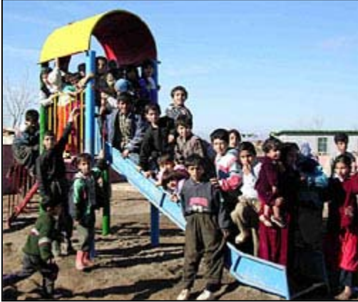
اطفال هورة مان سوف يمتلكون مكان جديد للتسلية واللعب.