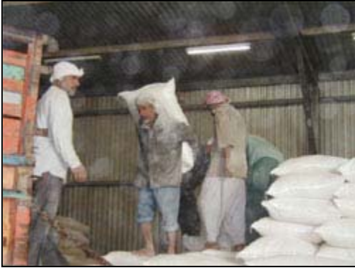
وكلاء من نظام التوزيع العام العراقي ينقلون الغذاء الى المخازن في عموم العراق.

الأمن الغذائي - - تتضمن مشاريع وكالة التنمية الدولية الامريكية في مجال الأمن الغذائي في العراق تقديم الدعم لنظام التوزيع العام الغذائي في عموم القطر والذي يوفر الغذاء الاساسي والسلع الغذائية وغير الغذائية الى تقريبا 25 مليون مواطن إضافة الى المشاركة في أعداد برامج المساعدات المادية بدل السلع الاساسية في نظام التوزيع العام لدعم الانتاج المحلي والبنى التحتية للأسواق العامة وتطوير الاصلاح الزراعي الشامل لأفضلية المشاركة الخاصة في الانتاج وأسواق البيع بالجملة .