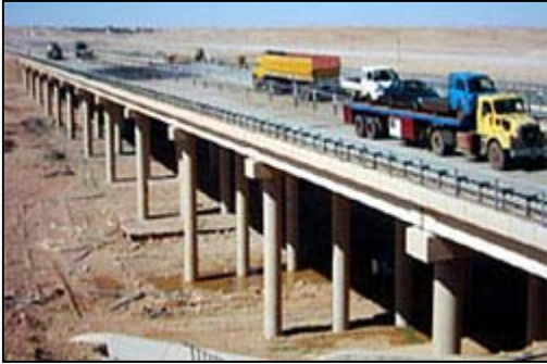
الامتداد الجنوبي لجسر الرطبة

الجسور والطرق وسكك الحديد - - تتضمن مشاريع وكالة التنمية الدولية الامريكية USAID في الجسور والطرق وسكك الحديد بأعادة تأهيل وتصلح أنظمة النقل المتضررة والتركيز على اكثر شبكات الطرق الحرجة و الاقتصادية .