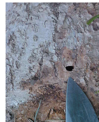
Daim Duab 3—Cov qhov tho tawm uas zoo li tus D yog tus EAB txoj kev qhia tias muaj kab.