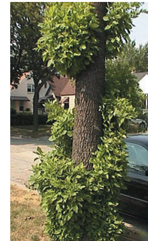
Daim Duab 4—Cov ceg hlav tawm yog cov uas yuav qhia tau tseeb tias tsoob ntoo muaj teeb meem.