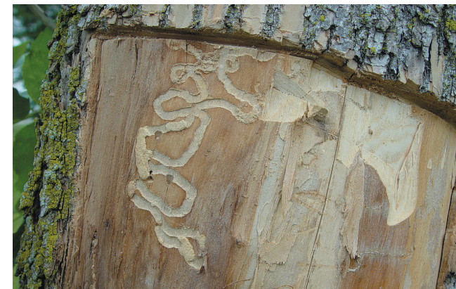
Daim Duab 2—Cov qhov zoo li tus S, yog cov menyuam kab EAB ua, muaj pawg lug rau cov ntoo tshauv uas twb raug cov kab lawm.