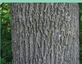
Daim Duab 9—Ntawm cov ntoo laus zog, cov tawv ntoo tshauv ua tau zoo li cov diamond (ndais-meess).