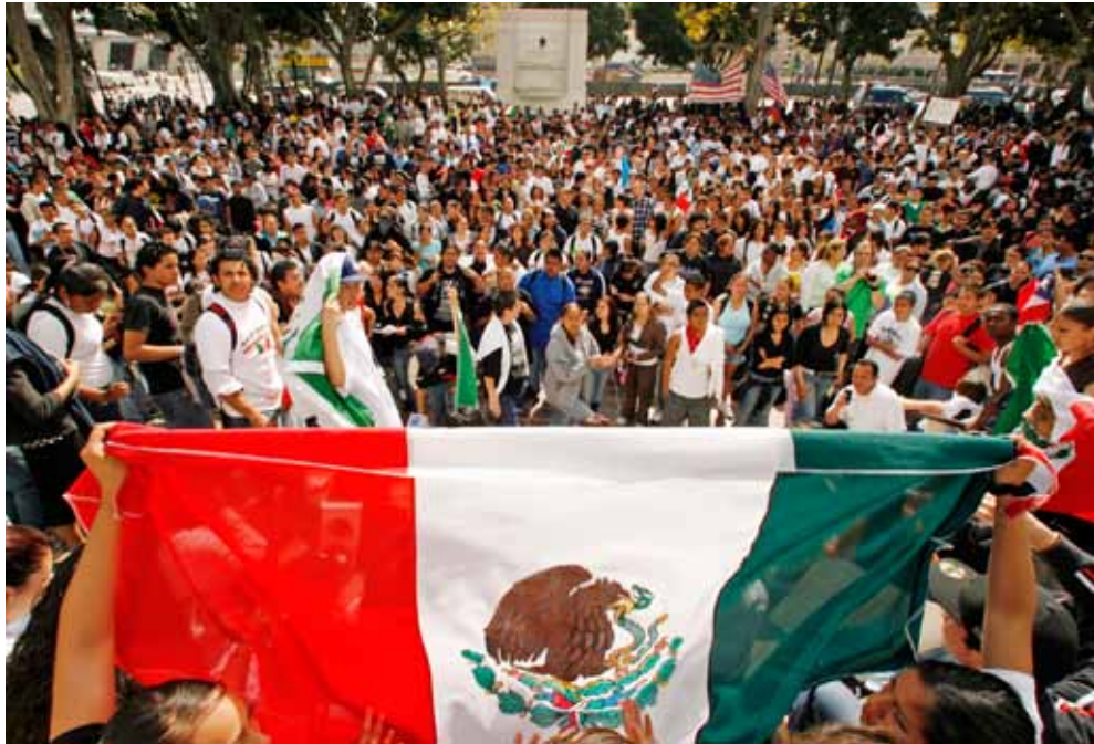
Los estudiantes de Los Angeles recurrieron a las comunicaciones electrónicas para organizar una sorprendente manifestación que congregó a 30.000 personas.

Las herramientas que permiten las telecomunicaciones, nuevas y simples, eliminan obstáculos a la acción colectiva de la gente común y corriente y, en consecuencia, cambian el mundo.