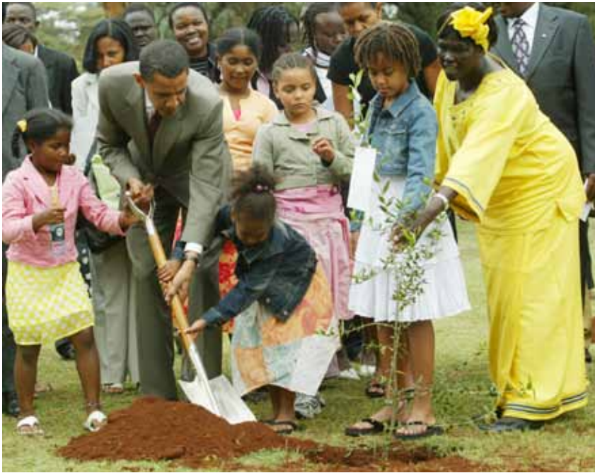
Wangari Maathai, a la derecha, junto a Barack Obama, planta un árbol en Nairobi, Kenia, en el 2006.

por la paz, protegiendo los derechos humanos, terminando con la pobreza o defendiendo la libertad de expresión.