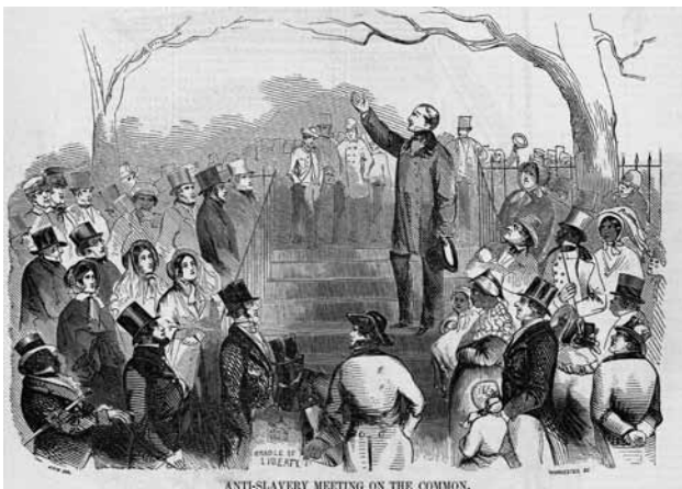
El abolicionista Wendell Phillips pronuncia un discurso en contra de la esclavitud en el parque público Boston Common en abril de 1851.

En la trayectoria histórica del principio de no violencia, el momento decisivo se produjo en las décadas segunda y tercera del siglo XIX, cuando un grupo de personas de