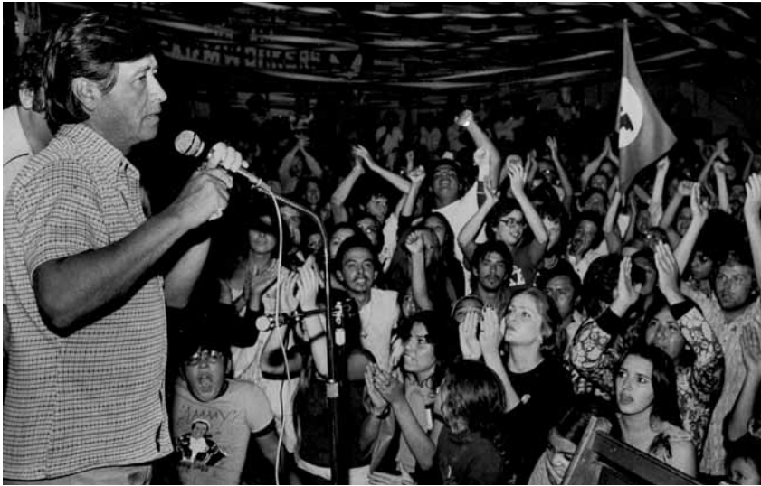
César Chávez aceptó el desafío de organizar a los trabajadores rurales.

problemas de ustedes. Hablemos de lo que ustedes van a hacer”.