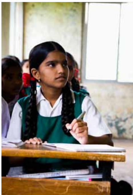
Se cree que la educación de las niñas conduce a la estabilidad demográfica y reduce el malestar social.