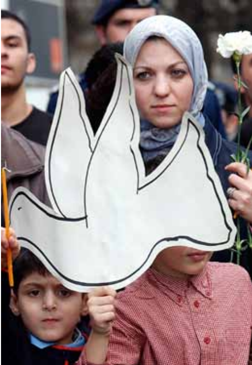
Manifestantes rumanos contra los terroristas en 2004.