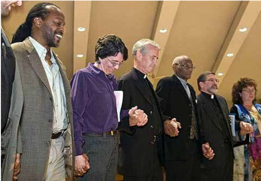
Acto de un grupo de organización comunitaria religiosa en Warren, Michigan, en favor de la unidad racial.

Los organizadores trabajan con el liderazgo de un grupo para elaborar campañas públicas eficaces y hacer que los intereses sean provechosos. La Asociación de Comunidades Organizadas para la Reforma Ahora (ACORN) tiene una red nacional, con más de 400.000 familias participantes en más de 100 ciudades, que están activas en muchos asuntos.