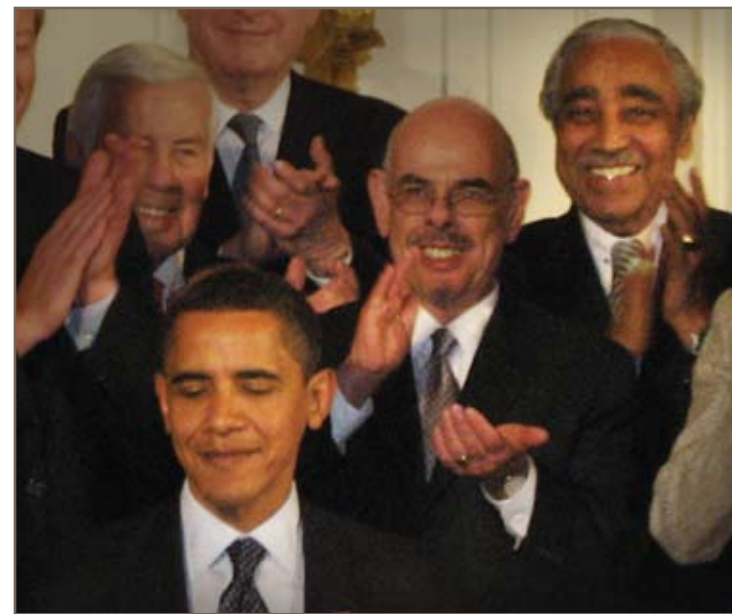
Congressman Rangel and colleagues join President Obama at the signing of landmark children's health care bill, benefitting 11 million more children.

3% Government Withholding. Delays the mandate that federal, state, and local governments withhold 3 percent of payments to businesses for goods and services, which is supported by the National Small Business Association.