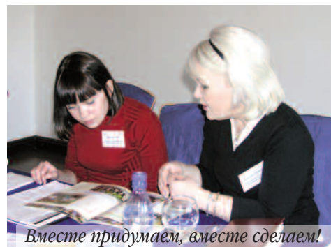
Вместе придумаем, вместе сделаем!

плодотворной работы мы поговорили о результатах этого года, поделились мнениями и опытом работы с выпускниками, обсудили новые пути взаимодействия и разработали план работы на следующий год.