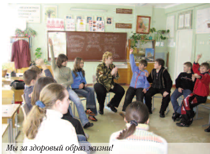
Мы за здоровый образ жизни!