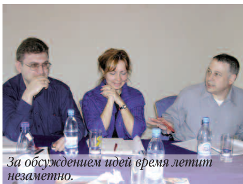
За обсуждением идей время летит незаметно.

Многие из наших выпускников уже успели лично или заочно познакомиться с представителями по работе с выпускниками в своих регионах. Всего их 7, по одному в каждом федеральном округе. Основная задача представителей