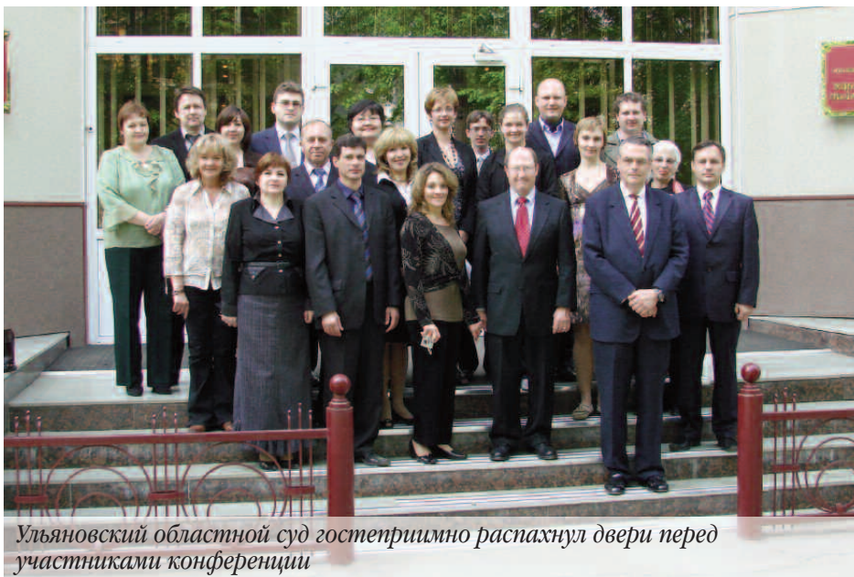
Ульяновский областной суд гостеприимно распахнул двери перед участниками конференции