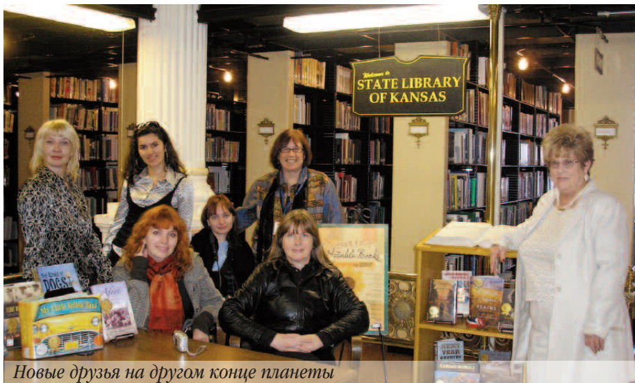
Новые друзья на другом конце планеты

- Виктория, сейчас я тебя познакомлю с двумя русскими, – вдруг шепнула мне на ухо Эллисон.