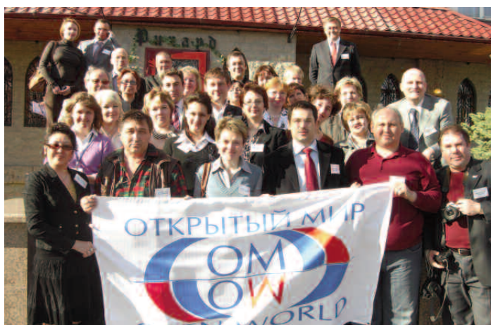
«Открытый мир», добро пожаловать в Челябинск!

Говорят, что сейчас общество более всего нуждается в информированных оптимистах – именно такими выглядят челябинцы: жизнерадостные, дружелюбные, интеллектуальные, соответствующие духу «Открытого мира». От юбилейной встречи осталось ощущение свежести, новых интонаций и эмоций.