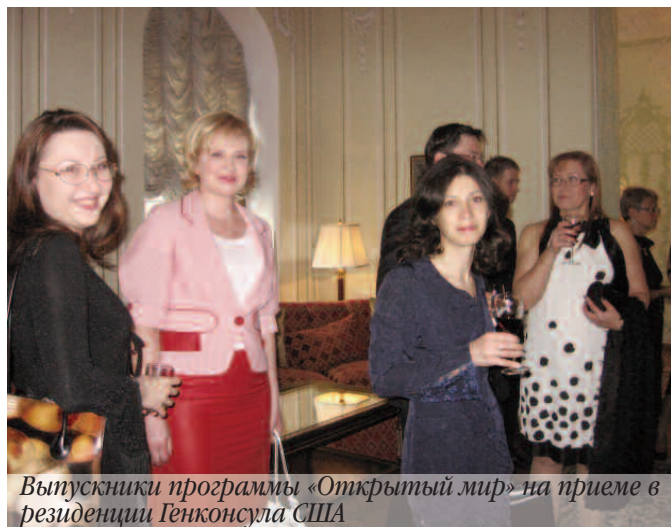
Выпускники программы «Открытый мир» на приеме в резиденции Генконсула США