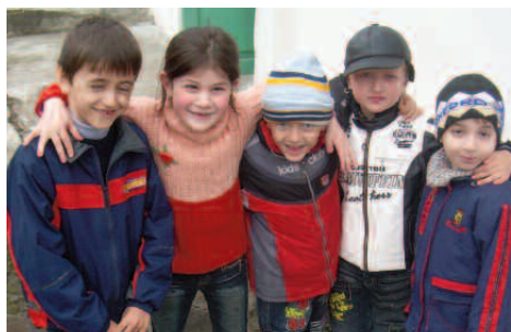
Юные участники проекта из Нальчика

К сожалению, мы не можем опубликовать все отзывы, но мы благодарны всем, кто прислал такие теплые слова и рассказал о тех идеях, мыслях и делах, на которые программа вдохновляет с 1999 года.