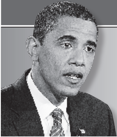
Barack Obama

« Joe Biden a toujours été du bon côté, et je crois qu'il ferait un président exceptionnel si, à Dieu ne plaise, il m'arrivait quelque chose. »