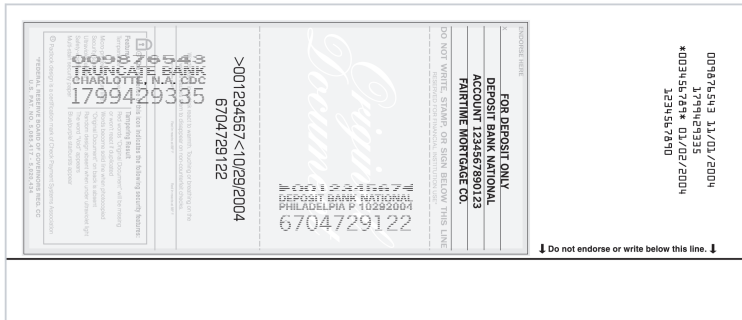
Dorso de un cheque sustituto