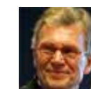
Tom Daschle Departamento de Salud y Servicios Sociales