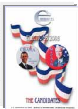
Elecciones 2008: Los Candidatos

http://www.america.gov/publications/ejournalusa/1008.html