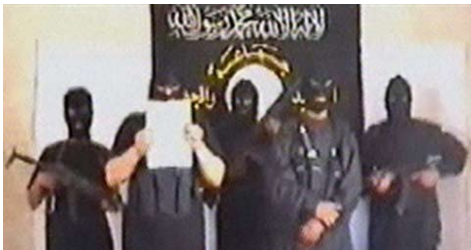
Снимок с видеозаписи, размещенной на исламистском веб-сайте в сентябре 2004 года, на котором террористы угрожают обезглавить захваченного западного заложника.