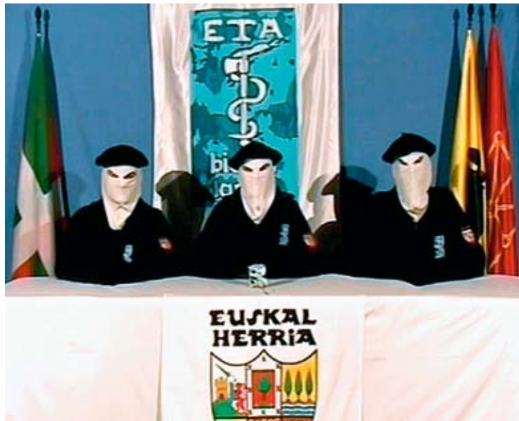
Три неустановленных лица в баскских беретах сидят перед флагом организации ETA во время телевизионной съемки в 2006 году. ETA (Euskadi Ta Askatasuna – «Родина и свобода басков») – террористическая группа, добивающаяся создания независимого от Испании государства басков, внесена в официальный список террористических групп Государственного департамента.

Во время Второй мировой войны и в течение двух десятилетий после ее окончания терроризм имел незначительные масштабы. Возможно, это объясняет, почему