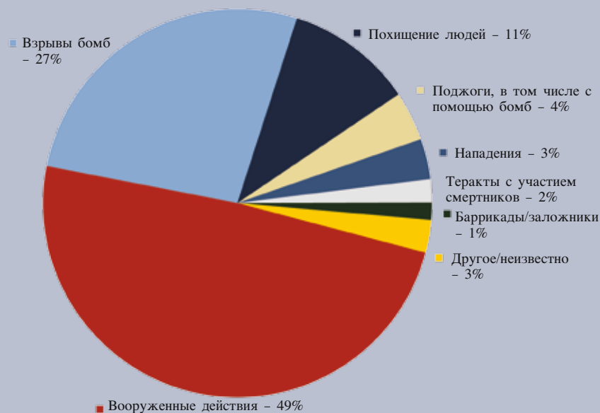
Рис. 2 Главные методы, используемые в терактах

Террористы пытаются манипулировать недовольством для радикализации других слоев населения, толкая их все дальше и дальше по пути незаконной деятельности. Лучшей иллюстрацией этого процесса является «конвейер» изготовления террориста – процесс, который начинается с попыток террористов склонить маргинальные или униженные слои населения к экстремистским воззрениям и постепенно превратить их сначала в сочувствующих, потом в сторонников и, наконец, в членов террористических сетей. В некоторых странах «Аль-Каида» и другие террористы пытаются эксплуатировать повстанческое движение и местные конфликты в качестве средств радикализации и вербовки, активно используя интернет для передачи своих призывов и сообщений. Противодействие такой практике требует от нас обращения с иммигрантами и молодым населением не как с источниками угрозы, от которой необходима защита,