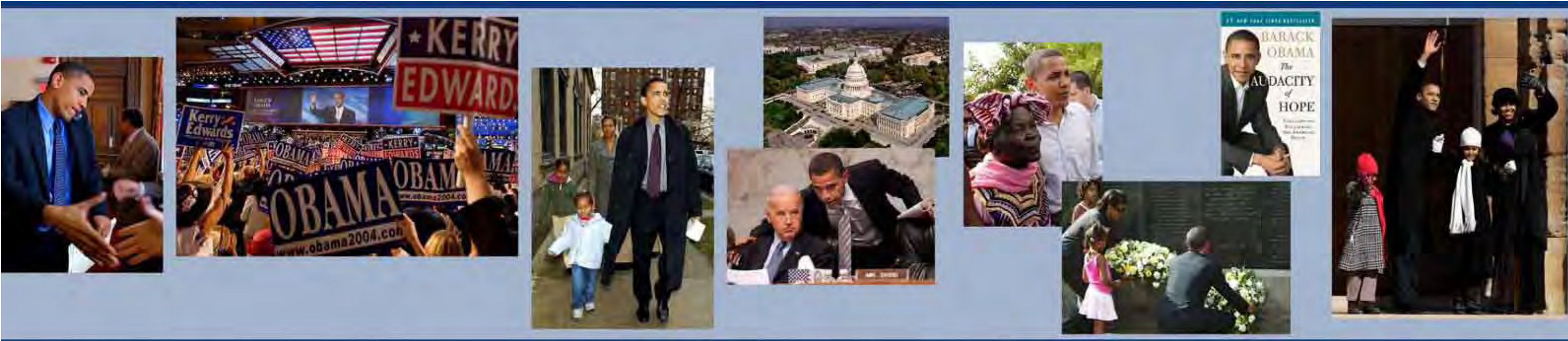
El senador estatal Obama contienda por la senaduría nacional como representante de Illinois en julio de 2004.

La larga campaña de elecciones primarias demócratas de 2008, con elecciones y asambleas electorales en los 50 estados, fue histórica en distintas maneras. Aspirantes afroamericanos y mujeres ya se habían presentado anteriormente como candidatos a la presidencia, pero esta vez los dos favoritos eran una