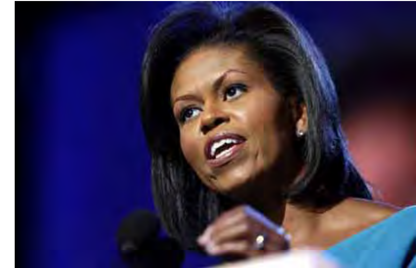
Arriba, Michelle Obama habla en la Convención Nacional Demócrata el 25 de agosto de 2008. Abajo, los Obama viajaron juntos en gran parte de la campaña presidencial.

Los Obama esperan que su entusiasmo por el servicio público, su vasta experiencia y sus logros en el terreno profesional los ayuden a lidiar con los desafíos que se avecinan. Detrás del deseo de