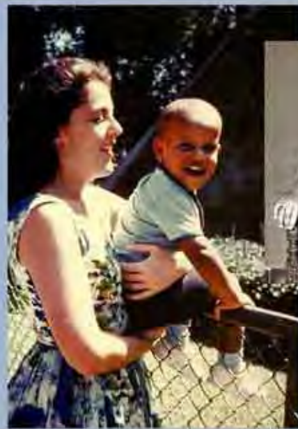
El pequeño Barack con su madre, Ann Dunham, hacia 1963.

En su primer libro, Dreams from My Father (Sueños de mi padre), Obama describe este período de su vida en el que tuvo algo más que la cuota ordinaria de confusión de un adolescente, pues se esforzaba por comprender una herencia birracial que entonces todavía era relativamente poco común en Estados