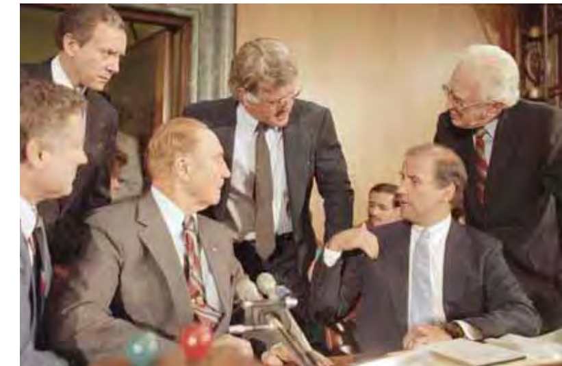
El senador Biden, sentado a la derecha, con otros miembros del Comité Judicial del Senado en agosto de 1986.

anteriormente presidido por Biden. No obstante, Obama y Biden estuvieron en desacuerdo en una cuestión esencial de política exterior. Biden votó a favor de la resolución final del Senado por la cual se autorizó la invasión estadounidense de Iraq, mientras que Obama (que en aquel entonces aún no era miembro del Senado) se pronunció en contra de ella.