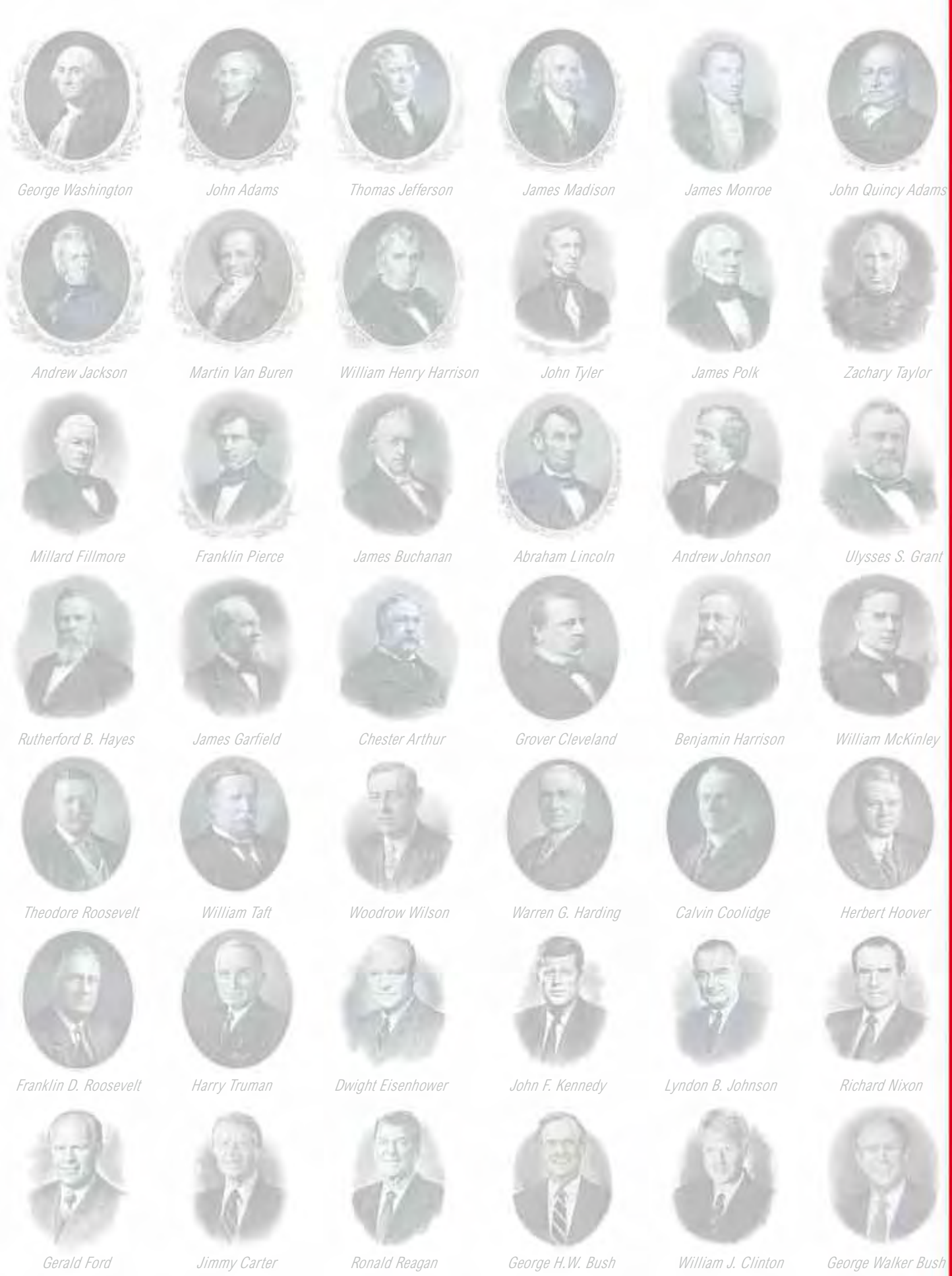
George Washington John Adams Thomas Jefferson James Madison James Monroe John Quincy Adams