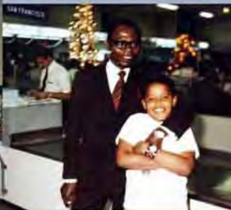
Barack a los 10 años con su padre keniano, Barack Obama Sr.