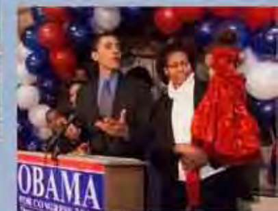
En la Facultad de Derecho de Harvard en Boston, Massachusetts, hacia 1991.