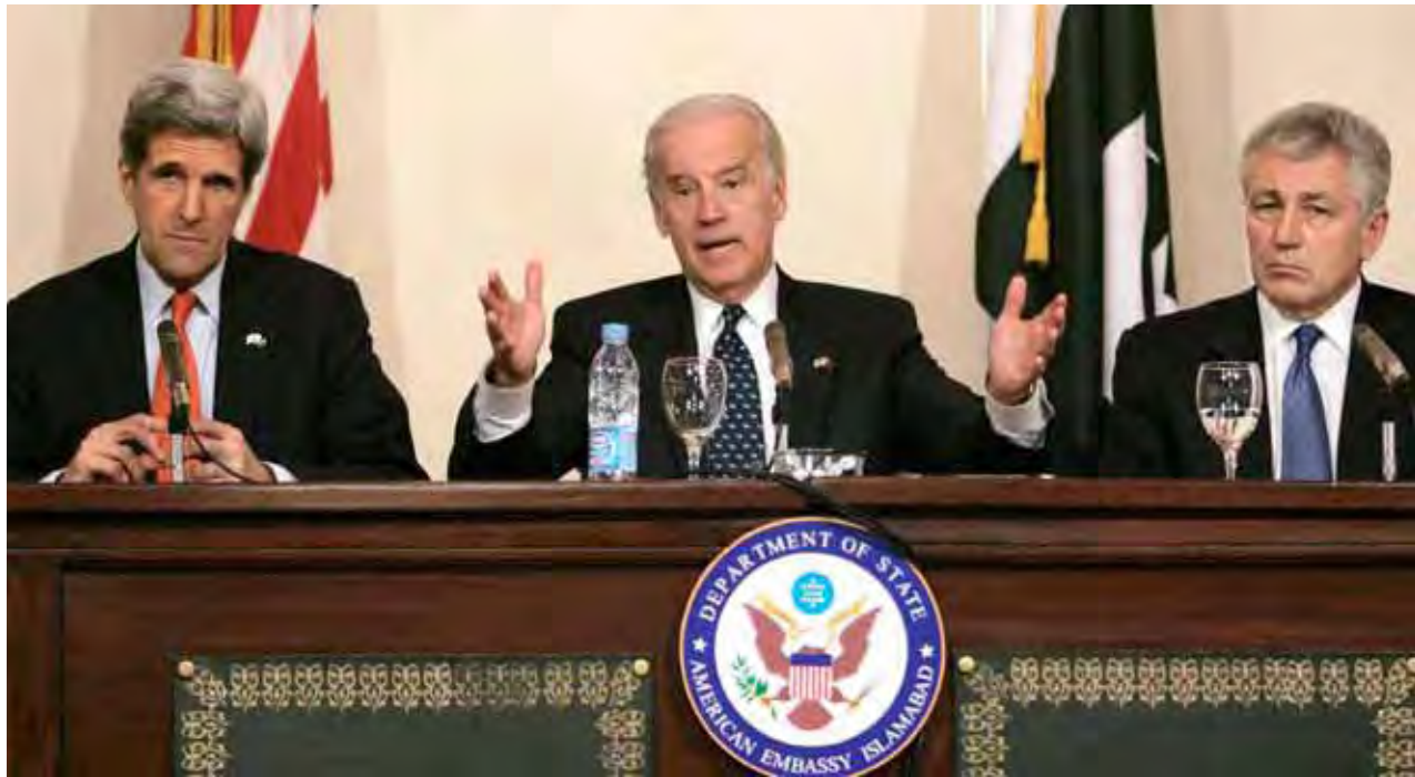
Los senadores de Estados Unidos, a partir de la izquierda, John Kerry, Joseph Biden y Charles Hagel en Islamabad, Pakistán, en febrero de 2008.

refirió a Biden como “un detractor decidido de la política exterior de Bush-McCain y una voz que clama por una nueva dirección que encauce la lucha hacia los terroristas y ponga fin a la guerra en Iraq de manera responsable”.