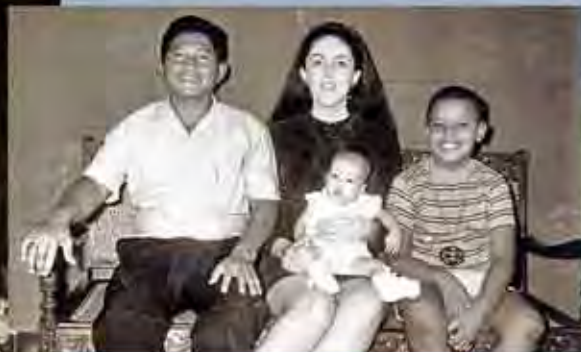
Barack a los nueve años de edad, en Indonesia, con su madre, su padrastro Lolo Soetoro y su media hermana Maya.