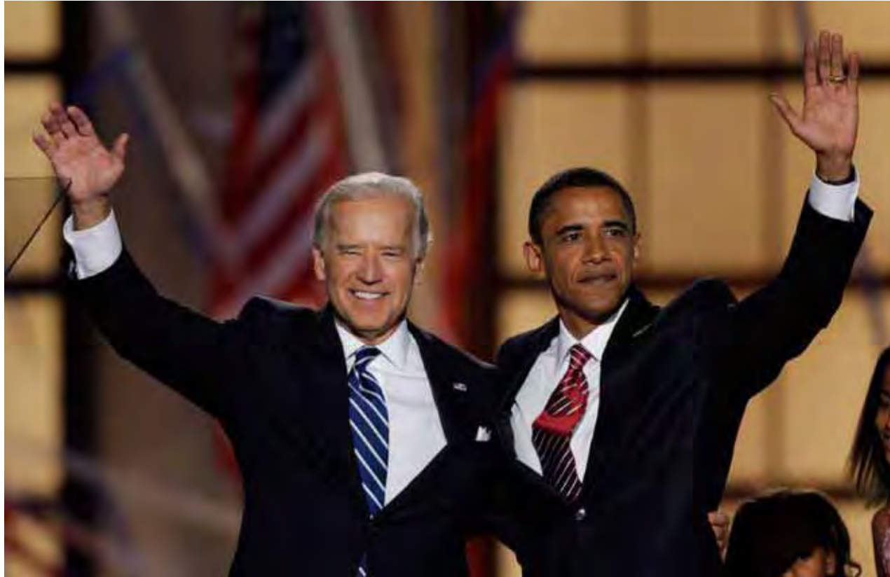
El candidato a la vicepresidencia Joe Biden, izquierda, con el candidato presidencial Barack Obama en la Convención Nacional Demócrata, el 28 de agosto de 2008.

“Cuento mi contribución para poner fin al genocidio en los Balcanes y asegurar la aprobación de la Ley sobre la Violencia contra la Mujer como los momentos de mi vida pública que más me enorgullecen”. Esto escribió el entonces senador Joseph R. Biden, hoy vicepresidente de Estados Unidos, en su autobiografía Promises to Keep: On Life and Politics (Promesas que cumplir: sobre la vida y la política), publicada en 2007.