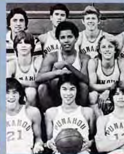
Barack Obama, al centro, con el equipo de baloncesto de su escuela secundaria, en Hawai, en 1977.