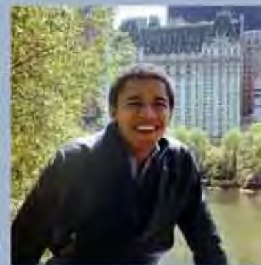
En sus tiempos de estudiante de la Universidad Columbia en Nueva York, hacia 1983.