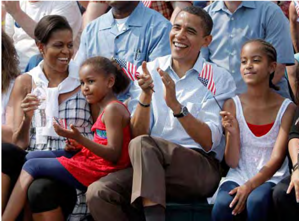
Los Obama disfrutaron el desfile del Día de la Independencia en Butte, Montana, el 4 de julio de 2008. A partir de la izquierda vemos a Michelle, Sasha, Barack y Malia.

L os Obama son la primera familia afroestadounidense que se muda a la Casa Blanca.