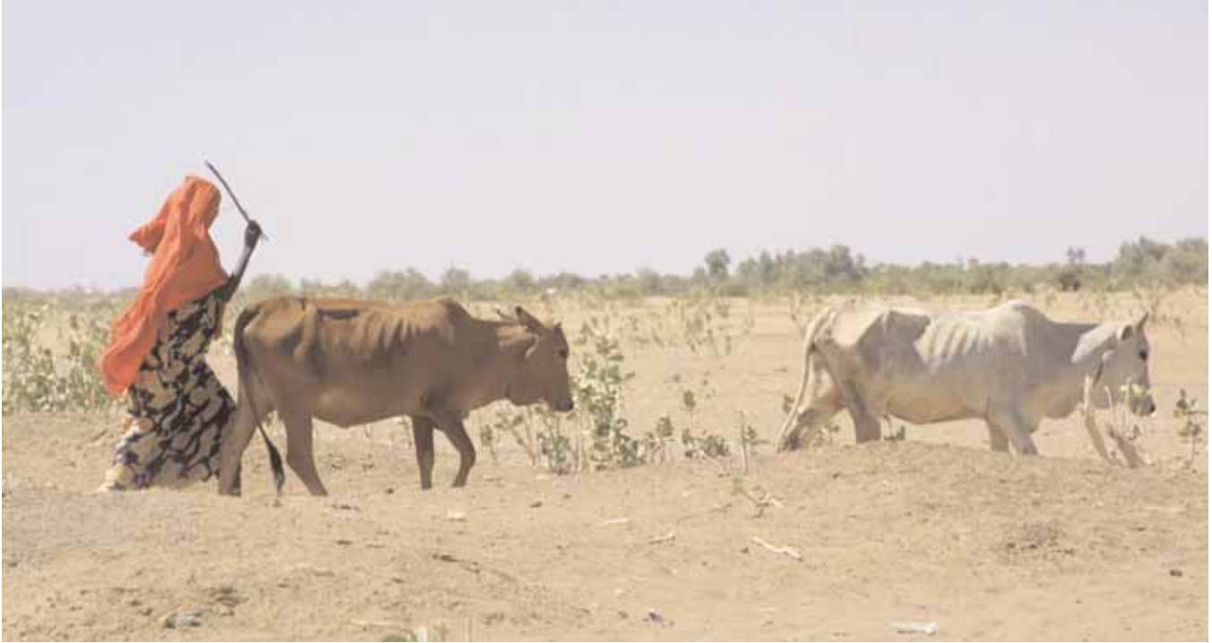
تعكف الوكالة الأميركية للتنمية الدولية على مساعدة الرعاة الأفارقة، كهذه المرأة التي تقود قطيعاً من البقر قرب زيواي بإثيوبيا، في المحافظة على سبل عيشهم.

بسبب الجفاف عدة مرات في السابق، ولكن العاملين في [المنظمة الإنسانية] كير ساعدونا في هذه المرة على بيع ماشيتنا قبل أن تنفق. بعت بقرة واحدة، وتمكنت من استخدام المال الذي حصلت عليه بذلك لاستئجار شاحنة لنقل بقراتي الأخرى إلى مكان يقع في الشمال، حيث تمكنت من البقاء على قيد الحياة. والآن انتهى الجفاف وما زلت أملك ماشيتي.”