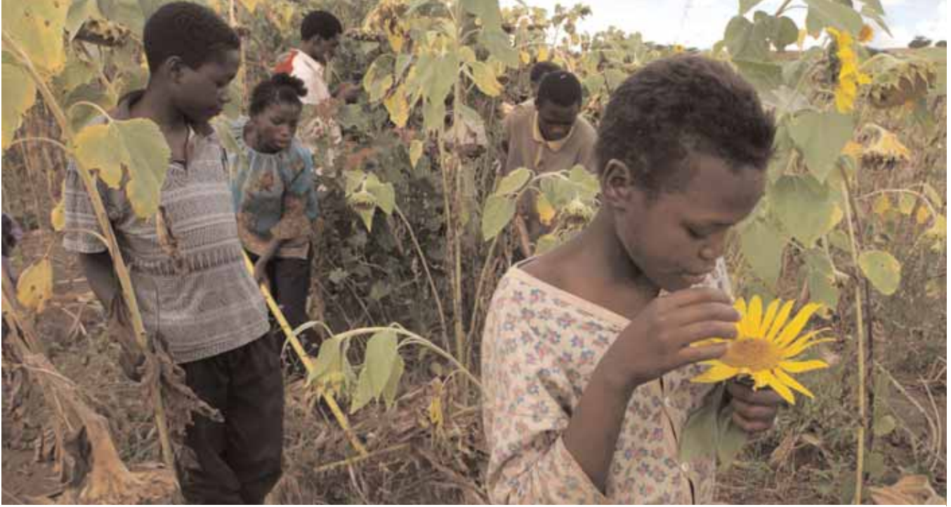
أحداث في تشيمويو بموزمبيق يتعلمون تقنيات زراعية في أحد حقول "المزارع الصغير والمدارس الحياتية"، وهو برنامج تديره وكالات تابعة للأمم المتحدة في ست دول.

يملكون من موارد وينزلقون نحو الفقر المدقع. ويتبع ذلك بسرعة تعرض أسرهم للجوع.