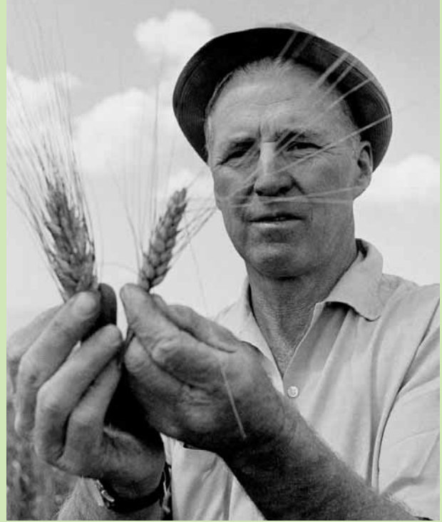
نورمان بورلوق في العام ١٩٧٠

يجب أن ندرك حقيقة أن وجود طعام كاف ما هو سوى أول الشروط الضرورية للحياة. ويتعين علينا لتحقيق حياة شريفة وإنسانية أن نوفر أيضاً فرصة للحصول على التعليم الجيد، والعمالة التي تدر مكافأة مالية جيدة، والسكن المريح، والملبس الجيد، والرعاية الطبية الفعالة الروؤفة. وما لم نتمكن من تحقيق ذلك، فإن الأمراض البيئية قد تصبح أسرع من الجوع في التأدية إلى انحطاط البشر. ومع ذلك فأنا متفائل بالنسبة لمستقبل الجنس البشري.