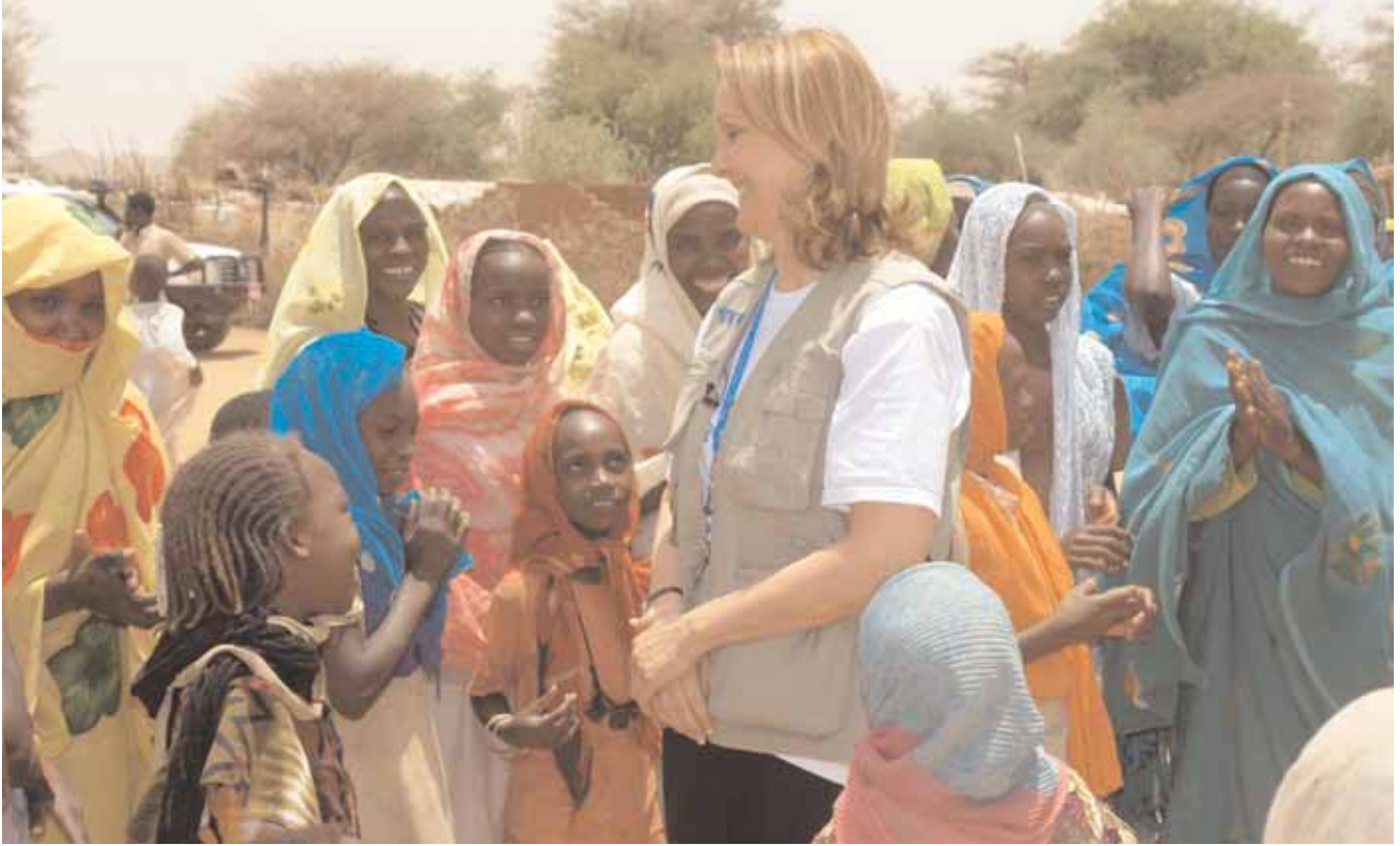
جوزيت شيران، المديرة التنفيذية لبرنامج الغذاء العالمي، تزور مخيم كساب للنازحين داخليا في كوتوم، في ولاية دار فور الشمالية، بالسودان.

الماضية. ولكن بالنظر للنمو السكاني في بعض أفقر المناطق في العالم، فإن عدد الجوع اليوم – من حيث الأرقام المطلقة – يفوق عددهم في أي وقت مضى. إنني أؤمن بقوة بأن بإمكاننا التغلب على الجوع، يمكننا ذلك وسنحقق ذلك، ولكن علينا أن ننشئ ونحشد ليس فقط العلم والتكنولوجيا المتوفرين لدينا، بل أيضا الإرادة السياسية لتحقيق ذلك. ولا زلنا نفقد اليوم طفلا يسقط ضحية للجوع كل خمس ثوان – وهو ثمن غير مقبول يفرضه الجوع علينا. ومع ذلك فنحن الآن في مرحلة من تاريخنا يتوفر لدينا فيها العلم والتكنولوجيا لإطعام كل شخص في العالم. وأمل في زيادة الوعي حول سبل تحقيق ذلك وفي تقديم الشكر العميق لمواطني الدول الكثيرة الذين يساهمون بشكل كبير في محاربة الجوع.