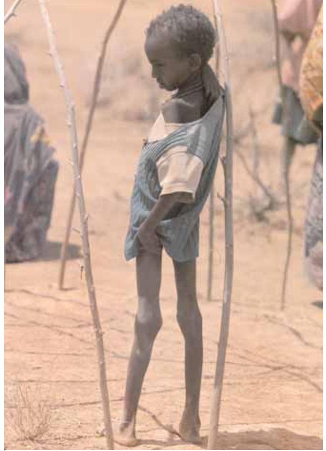
يؤثر الجوع على الملايين في إثيوبيا التي تتعرض للجفاف، كما هو الحال في أجزاء واسعة من منطقة القرن الإفريقي. برينان لنزلي

إن الجوع مسألة معقدة، وتحتاج معالجتها بصورة ملائمة إلى الارتكاز إلى فهم سبب وجوده في المقام الأول، بمعزل عن التأويلات الخاطئة والاعتقادات المغلوطة التي لا ترتكز إلى أي أساس من الصحة. الاعتقاد الخاطئ رقم 1: يقاسي الناس من الجوع بسبب عدم إنتاج ما يكفي من الغذاء — الأمر يتعلق بالإمدادات. الحقيقة: لقد حافظت إمدادات الغذاء العالمية حتى الآن على معدل نمو يجاري معدل نمو سكان العالم، متحدياً سيناريوهات مالتوس المتعلقة بنهاية العالم نتيجة الانفجار السكاني أي نمو السكان بسرعة تزيد عن سرعة نمو إنتاج الغذاء. إلا أن هناك في نفس الوقت مناطق كثيرة في العالم، تعجز بصورة مستمرة عن سد احتياجات سكانها إلى الطعام من