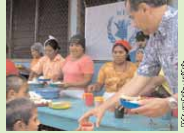
السفير غادي فاسكويز يساعد في تقديم وجبة غذاء في هندوراس.

وتخدم البعثة الأميركية كحلقة الوصل الرئيسية بين الحكومة الأميركية والمنظمات الرئيسية الثلاث التابعة للأمم المتحدة المكرسة للغذاء والزراعة؟ منظمة الأغذية والزراعة (فاو)، وبرنامج الغذاء