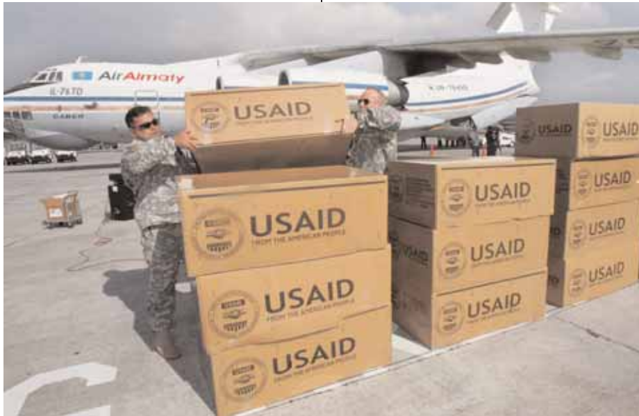
سيقرر الكونغرس ما إذا كانت المعونات الغذائية الأميركية ستتألف كلها من سلع من إنتاج الولايات المتحدة أو ما إذا كان سيصبح من الممكن شراء جزء من الطعام من منتجين أجانب في أماكن أقرب إلى البلد المعاني من الحاجة الطارئة.