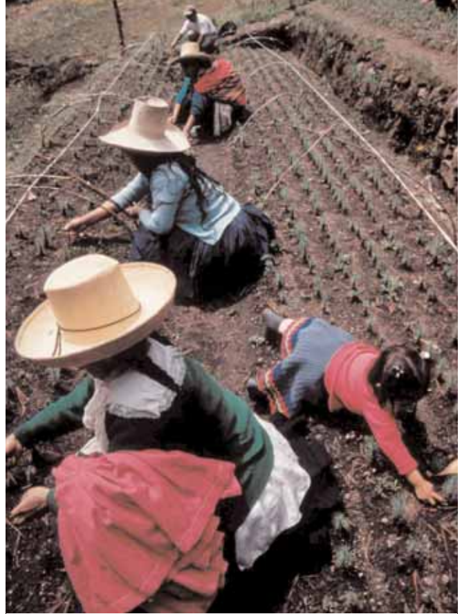
نساء في كاهاماركا في شمال الأنديز ببيرو يعتنين بالمحاصيل الزراعية في حقل مجتمعين المشترك كجزء من نشاطات الغذاء مقابل العمل التابع لبرنامج الغذاء العالمي.

شيران: أعتقد بأنه ينبغي على الأميركيين أن يكونوا فخورين بمساهماتهم عبر عدة عقود في محاربة الجوع. ولا يقتصر الأمر على