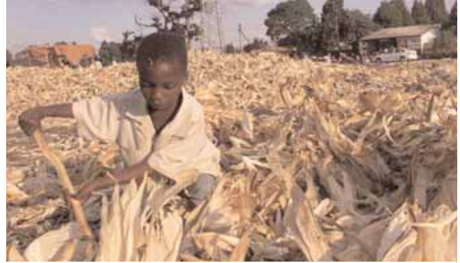
ساعدت السياسات السبئية في زمبابوي على تحويل أرض زراعية غنية إلى بلد جائع. (ثيمبا هديبي)

لأنهم استفادوا من أوجه التقدم المستدام في تكنولوجيا الغذاء. ولم تؤد بعض أوجه التقدم، وخاصة في التكنولوجيا الحيوية، على زيادة الإنتاجية فحسب، بل يمكنها أيضا إنتاج أنواع من النباتات أكثر مقاومة للجفاف، وتحتوي على قيمة غذائية أكبر، وتتطلب قدرا أقل من المواد الكيميائية، كما أنها أكثر مقاومة للآفات الزراعية. ويمكن، من خلال برنامج دولي منسق، يضم كلا القطاعين العام والخاص، تسخير قوة التكنولوجيا الحيوية بحيث تعود بالفائدة على المزارعين والمستهلكين في الدول النامية. ومما يشجع أن مؤسسة بيل وميلندا غيتس ومؤسسة روكفيلر قررتا العمل معاً على معالجة موضوع الزراعة. ويمكننا، من خلال توفر مساعدات دولية أقوى، توقع مبادرات حتى أكثر أهمية من باحثين مثل مونتي جونز من سيراليون، الذي قام بتحسين تقنيات زراعة الرز في غرب إفريقيا.