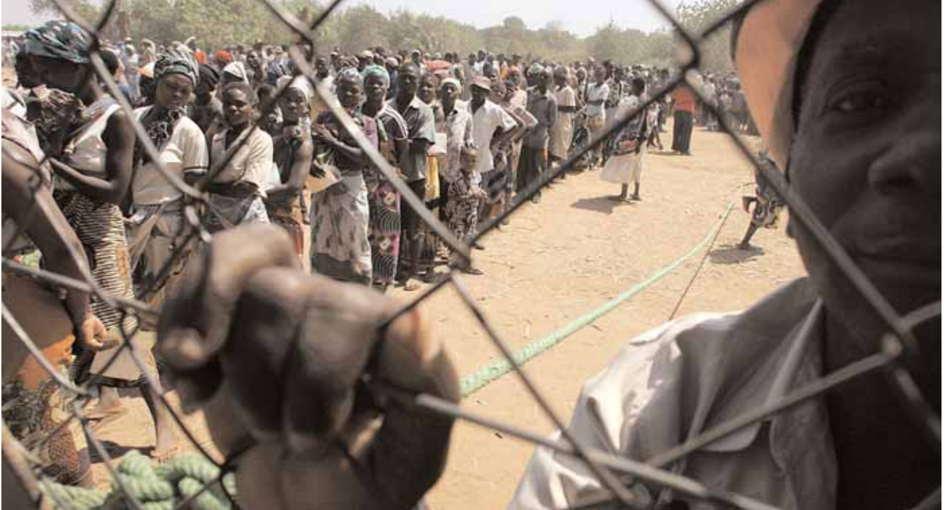
مجموعة بانتظار الحصول على الذرة في مركز للتوزيع في سانجي بملاوي، وهي واحدة من الدول الأكثر تأثراً بوباء نقص المناعة المكتسب/ الإيدز. أوبد زيلوا

المعركة العالمية ضد هذا المرض المدمر، إذ تضم تسعاً من الدول العشر التي تعاني من أعلى معدلات للإصابة بفيروس نقص المناعة المكتسب/ الإيدز. وقد أعاد مرض الإيدز معدل طول الحياة المتوقع إلى مستويات القرون الوسطى — إلى منتصف الثلاثينات — في العديد من دول المنطقة. ووجه المرض ضربة شديدة إلى القطاع الإنتاجي، حيث حصد أرواح الكثير من الموظفين المدنيين الحكوميين والمعلمين والأطباء ورجال الأعمال والمزارعين — مما أضعف الحكومات والبنية التحتية المدنية والاجتماعية. وقد توفي ما يقدر بثمانية ملايين مزارع متأثرين بمرض الإيدز خلال العقد الماضي في إفريقيا الجنوبية. وطبقاً لتقرير حديث لمنظمة أوكسفام الدولية، تشير معدلات الوفيات الحالية إلى أن خمس القوة العاملة الزراعية في دول إفريقيا الجنوبية ستهلك من مرض الإيدز بحلول العام ٢٠٢٠.