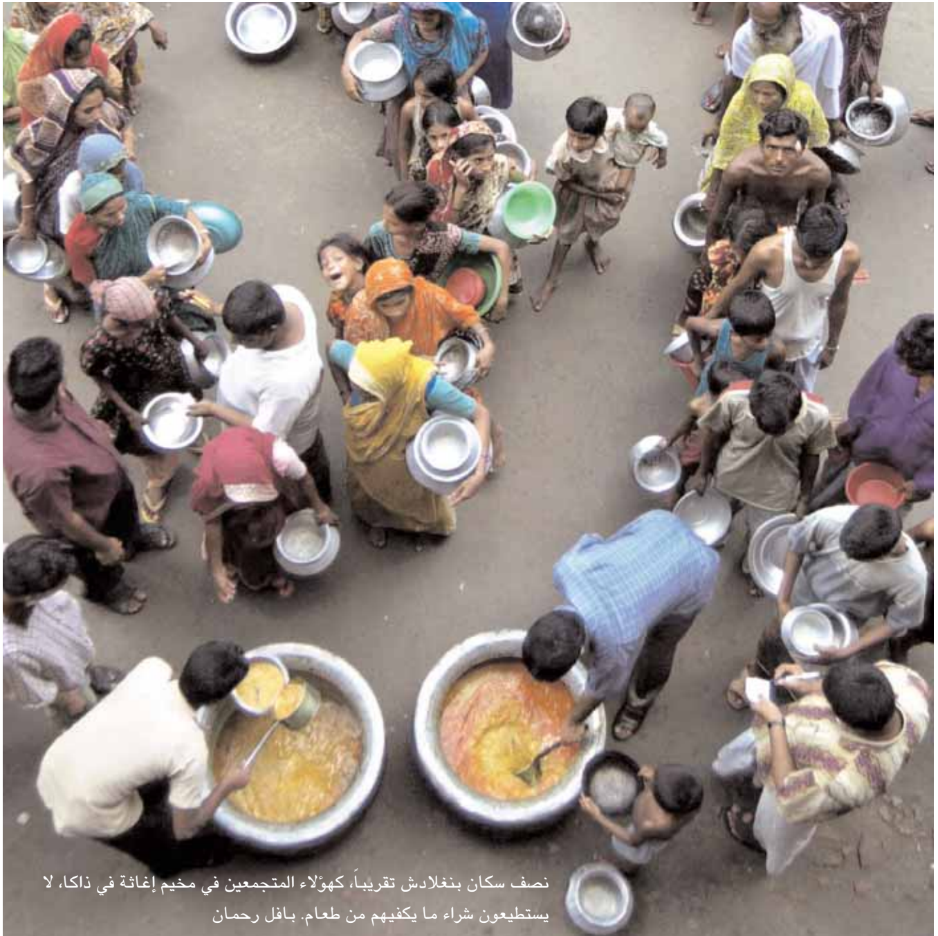
نصف سكان بنغلادش تقريباً، كهؤلاء المتجمعين في مخيم إغاثة في ناكا، لا يستطيعون شراء ما يكفيهم من طعام. بافل رحمان

الآراء المعبر عنها في هذا المقال لا تعكس بالضرورة آراء أو سياسات الحكومة الأمريكية.