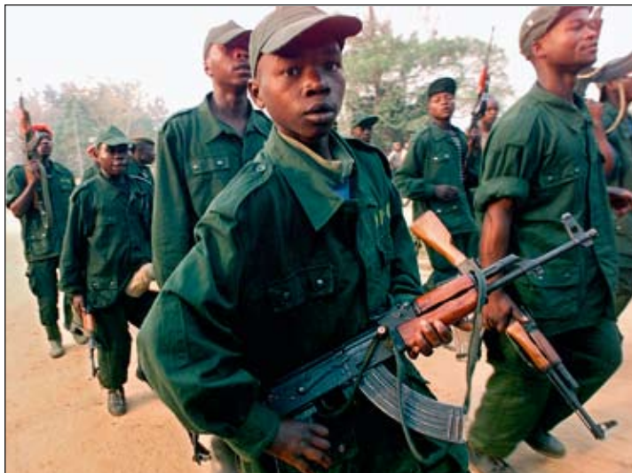
Це – юні воїни з конголезької групи заколотників. У всьому світі сотні тисяч дітей віком до 18 років вербують для участі в бойових діях.

Всупереч думці, що побутує на Заході, терористи все успішніше вербують до своїх лав молодих мусульман і, що ще тривожніше, – дівчат. Однією з головних причин цієї перемоги терористів є те, що їм вдається тримати значну частину ісламського світу в повному невігластві й ізоляції від нових ідей.