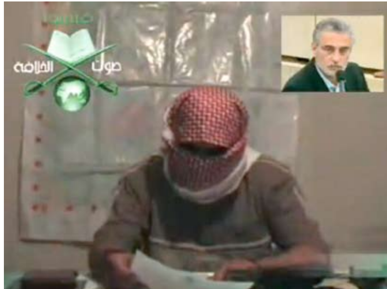
«Аль-Каїда» веде трансляцію на власному каналі «Голос Халіфату».

Сучасний тероризм можна зрозуміти з точки зору вимог, висунутих до будь-якої театральної постановки, які включають такі етапи: ретельна підготовка сценарію, відбір акторів, встановлення декорацій, наявність реквізиту, розподіл і виконання ролей, активна роль режисера – ведучого у підготовці спектаклю. Як і кожна гарна постановка драматичних або балетних спектаклів, ефективно висвітлювання терористичних актів у ЗМІ ви-