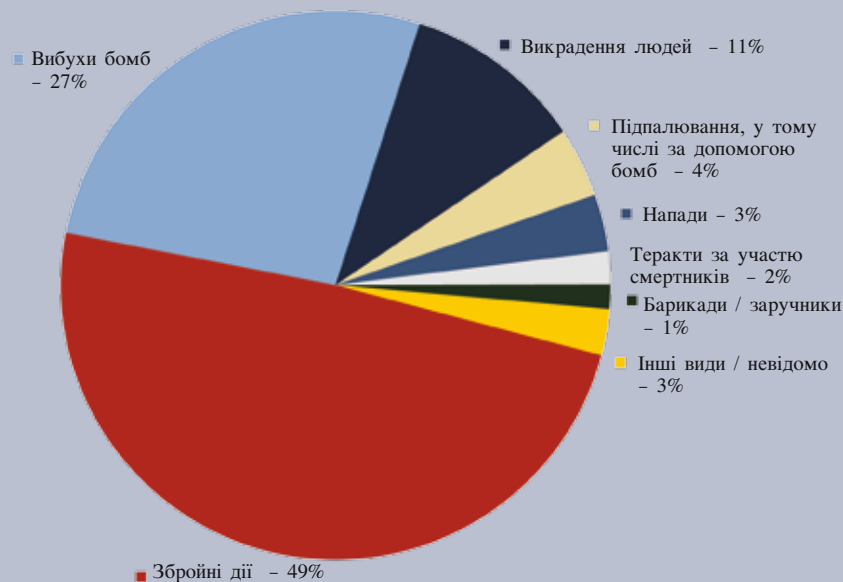
Малюнок 2 Головні методи ведення терактів

У 2006 році здійснено 14 352 теракти При застосуванні різних методів іноді трапляється подвійний підрахунок.